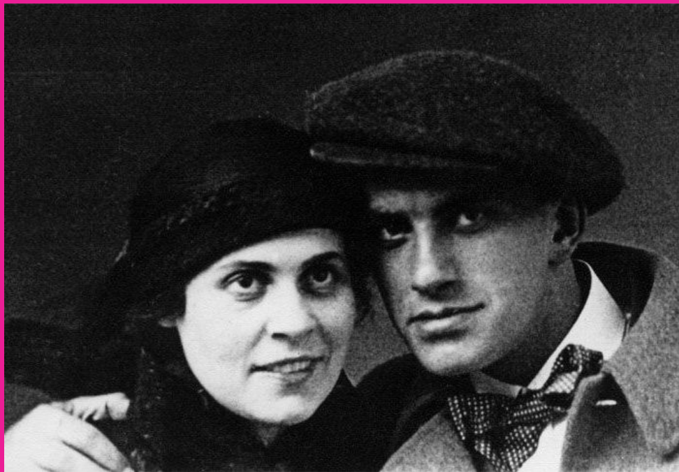
В.Маяковский и Л. Брик