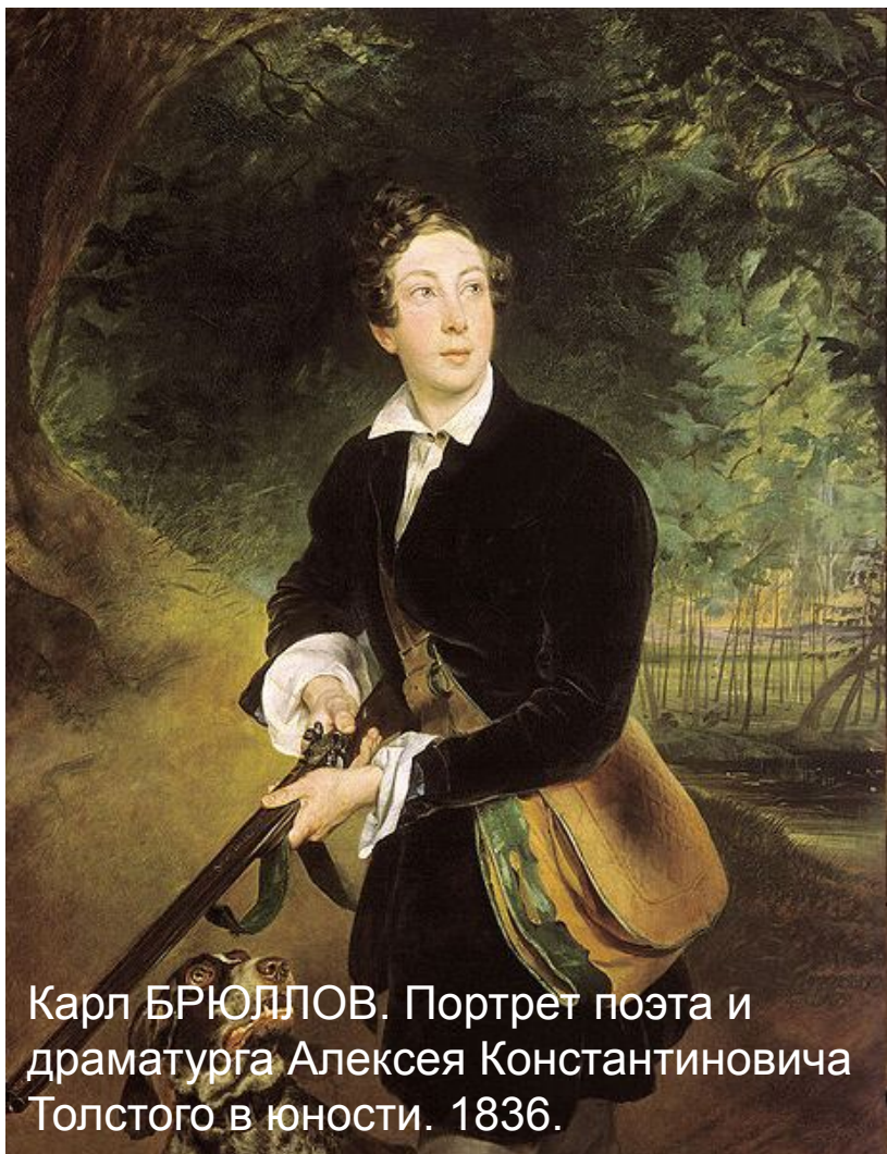
Карл БРЮЛЛОВ. Портрет поэта и драматурга Алексея Константиновича Толстого в юности. 1836.

Алексей Толстой (наибольший в количественном исчислении вклад), братья Алексей, Владимир и Александр Жемчужниковы).