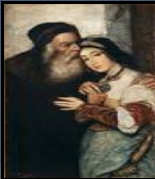
Герои Шекспира Маурицио Готтлиб Шейлок.