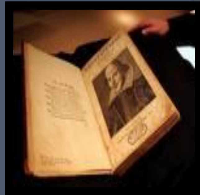
РАННИЕ ПЬЕСЫ ШЕКСПИРА.