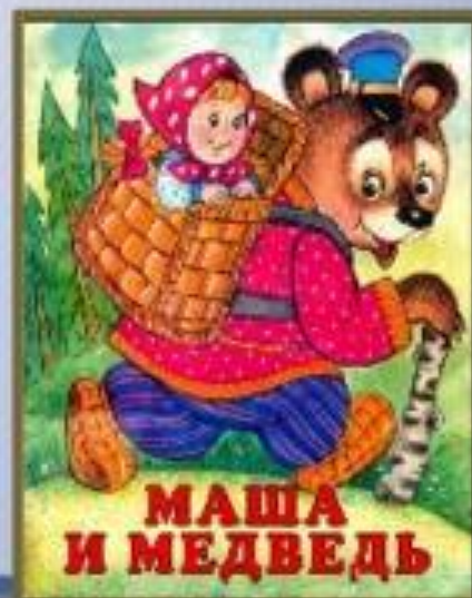
МАША И МЕДВЕДЬ