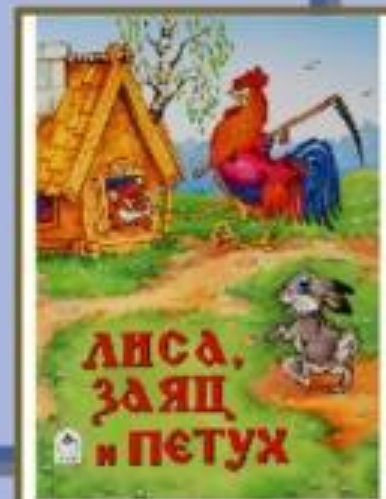
ЛИСА, ЗАЯЦ И ПЕТУХ