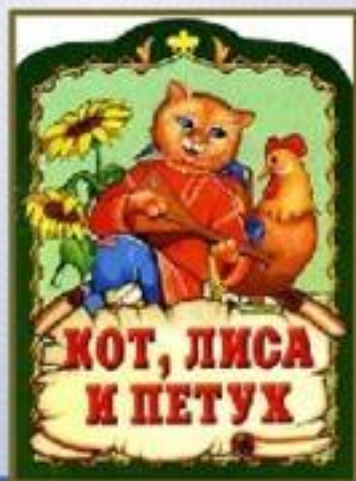
КОТ, ЛИСА И ПЕТУХ