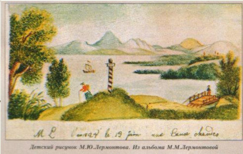
Детский рисунок М.Ю.Лермонтова. Из альбома М.М.Лермонтовой

Бабушка постоянно возила внука на лечение в Пятигорск. Кавказская природа поразила мальчика. Он увидел снежные вершины гор, бьющие на Машуке серные источники, степь на десятки верст, бурные и быстрые реки.