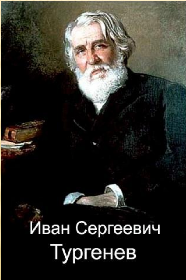
Иван Сергеевич Тургенев

Соотнести повесный и живописный портреты