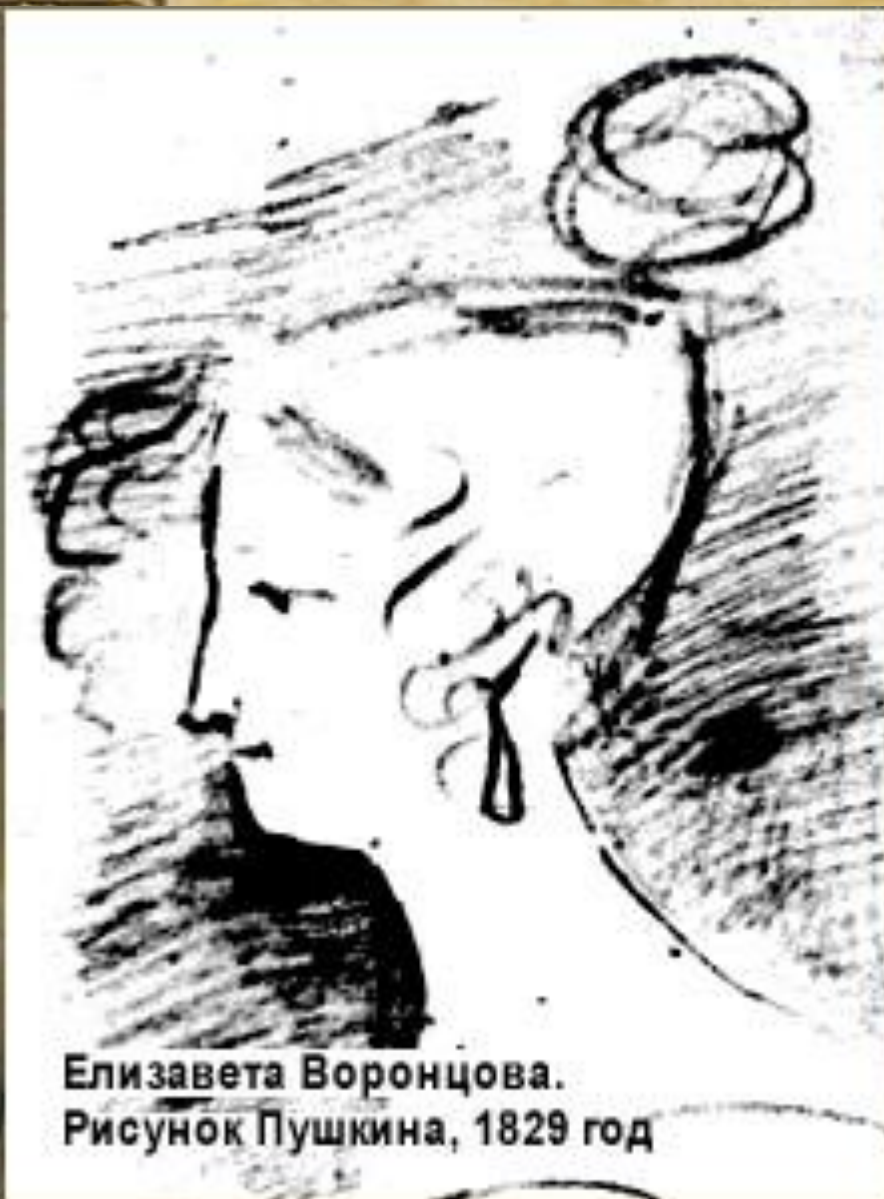
Елизавета Воронцова. Рисунок Пушкина, 1829 год