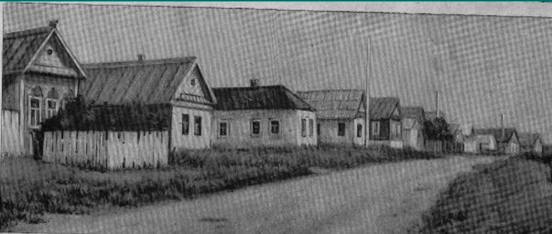
Оренбург өлкәсе, Шарлык районы, Мостафа авылы