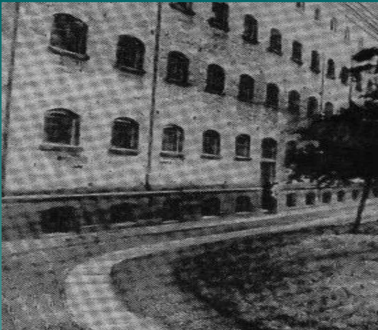
Моабит төрмәсенең ишегалды