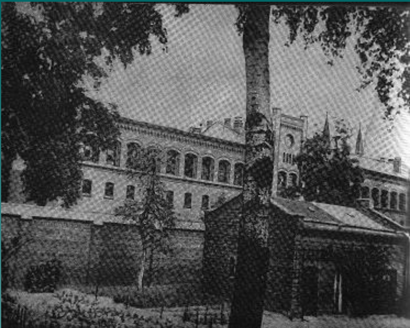
Плётцензее (Берлин) төрмәсе