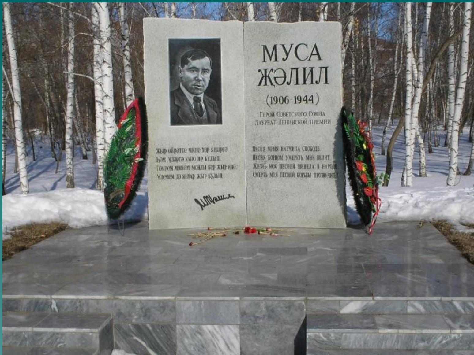
Әсәкәй авылы, Муса Жәлил паркы һәм мемориаль такта