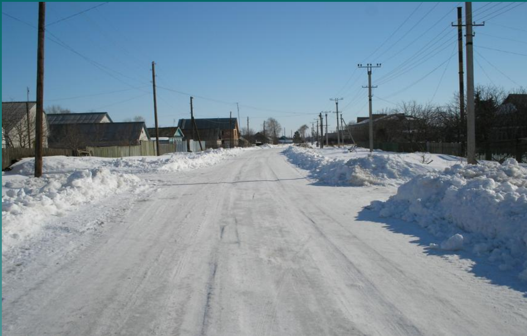
Әсәкәй авылы, Муса Жәлил урамы