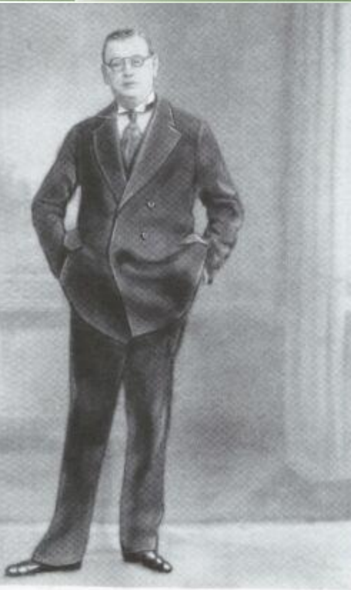
А. Т. Аверченко

Первый рассказ «Уменьше жить» был опубликован в харьковском журнале «Одуванчик» в 1902г. В 1903г. в харьковской газете "Южный край" был опубликован рассказ Аверченко "Как мне пришлось застраховать жизнь", в котором уже чувствуется его литературный стиль. Серьезной заявкой литератора явился рассказ «Праведник», опубликованный в Санкт-Петербурге в «Журнале для всех» в 1904г. В период революционных событий 1905–1907 годов А.Аверченко обнаруживает публицистический талант и предприимчивость, широко публикуя в недолговечных периодических изданиях очерки, фельетоны и юморески и выпустив несколько номеров быстро запрещенных цензурой собственных сатирических журналов «Штык» и «Меч».