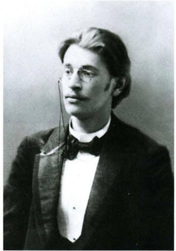
Аркадий Аверченко. Самая ранняя из дошедших до нас фотографий писателя. Харьков. 1901 г.

А.Аверченко окончил всего два класса гимназии, доучивался он «дома, с помощью старших сестер» (из автобиографии). В 1896 году, пятнадцати лет от роду, он поступил на работу младшим писцом в транспортную контору. Через год уехал из Севастополя и стал работать конторщиком на Брянском угольном руднике, где прослужил три года. В 1900 г. переехал в Харьков на службу в той же акционерной компании.