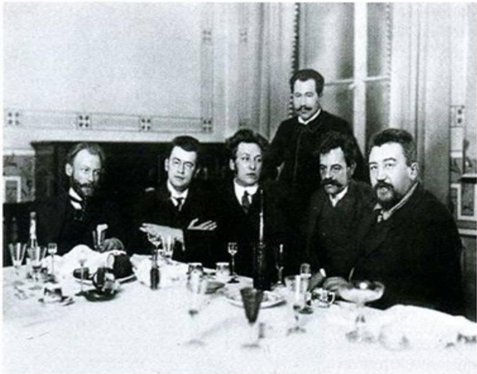
В редакции «Сатирикона». Среди сотрудников и авторов журнала Аркадий Аверченко (второй слева), Алексей Радаков (третий слева), Александр Куприн (крайний справа). 1909 г.

Ориентация на читателя среднего класса, пробужденного революцией и живо интересующегося политикой и литературой, обеспечила «Сатирикону» его огромный успех. Помимо завзятых юмористов, таких, как Петр Потемкин, Саша Черный, Осип Дымов, Аркадий Бухов, к сотрудничеству в журнале Аверченко сумел привлечь Л. Андреева, С. Маршак, А. Куприна, А.Н. Толстого, С. Городецкого и многих других поэтов и прозаиков. Постоянным сотрудником «Сатирикона» и вдохновителем всех журнальных начинаний был сам Аверченко; становлением писателя первой величины