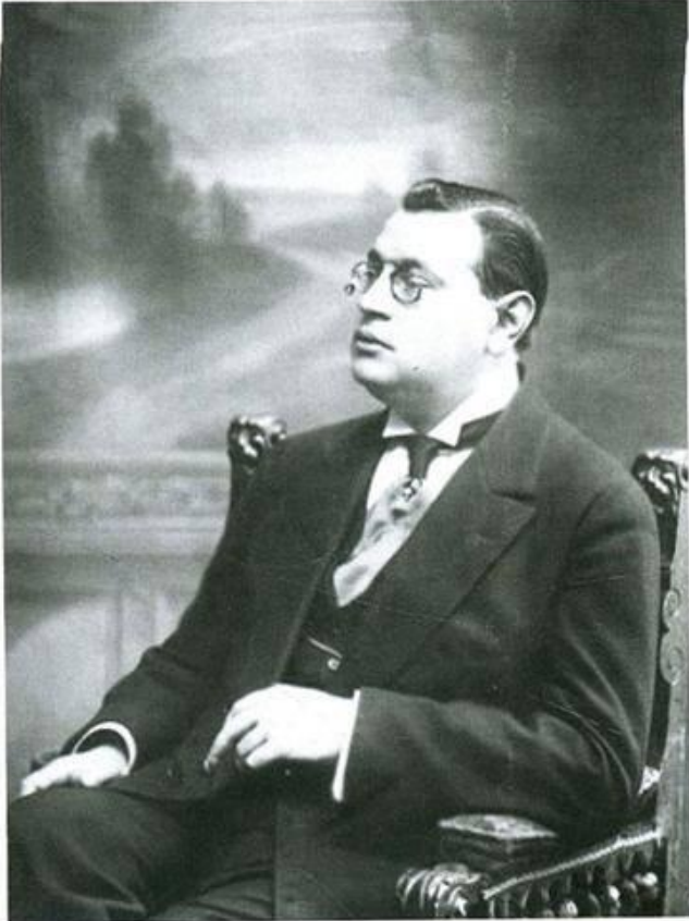
Господин редактор Ave.

Февральскую революцию 1917г. А. Аверченко со своим «Новым Сатириконом», разумеется, приветствовал; однако последовавшая за ней разнузданная «демократическая» свистопляска вызывала у него возраставшую настороженность, а октябрьский большевистский переворот был воспринят А.Аверченко, вместе с подавляющим большинством российской интеллигенции как чудовищное недоразумение. В августе 1918 г. «Новый Сатирикон» был запрещен, и А.Аверченко бежал на белогвардейский Юг, где публиковал в газетах «Приазовский край», «Юг России» и др. антибольшевистские памфлеты и фельетоны, а в октябре 1920 г. отбыл в Константинополь (ныне Стамбул) с одним из последних врангелевских транспортов.