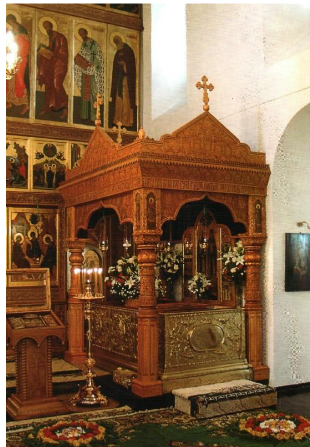
Рака (гробница) с мощами святых Петра и Февронии