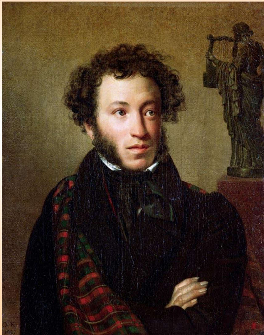
Александр Сергеевич Пушкин 1799 - 1837

«Любви все возрасты покорны, её порывы благотворны...»