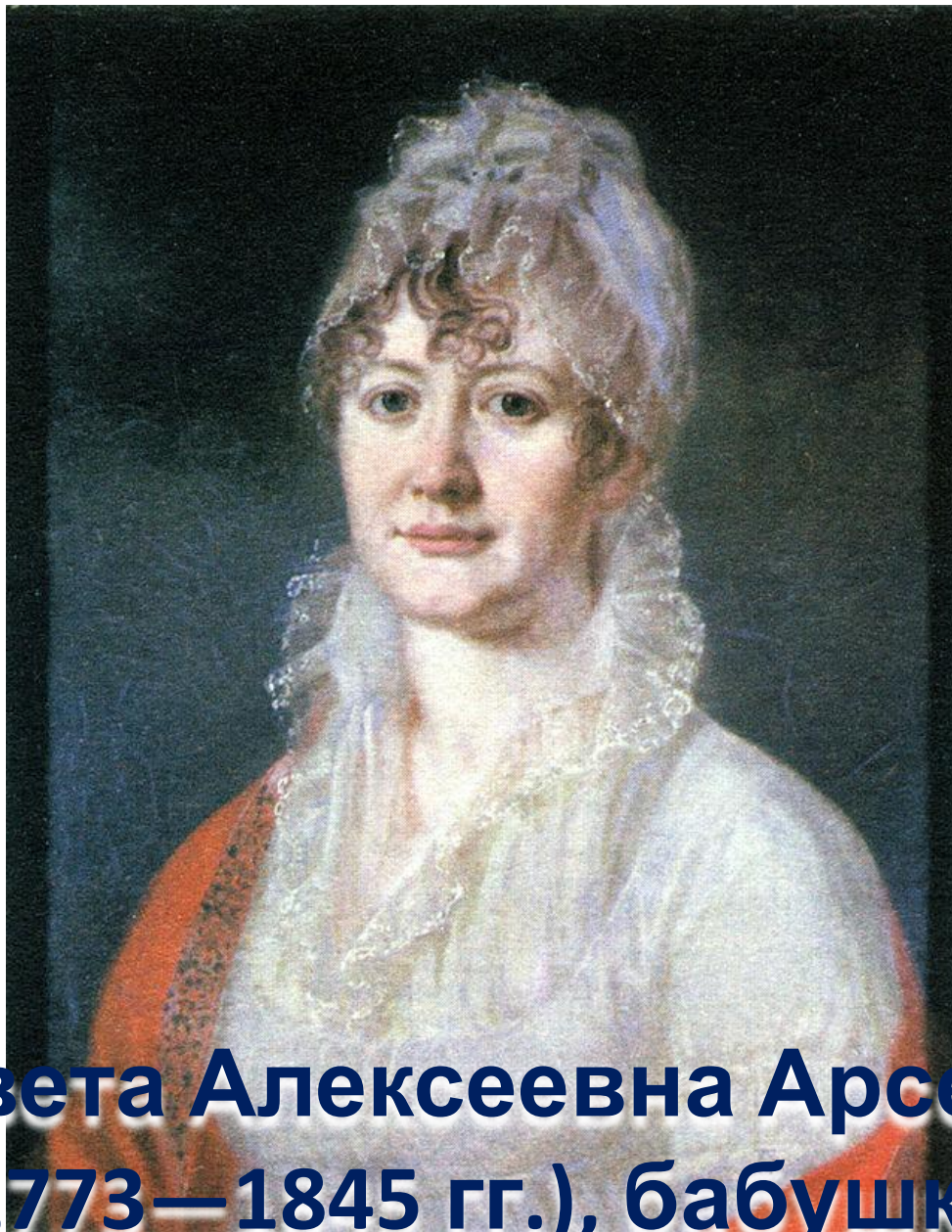
Елизавета Алексеевна Арсеньева (1773—1845 гг.), бабушка М. Ю. Лермонтова