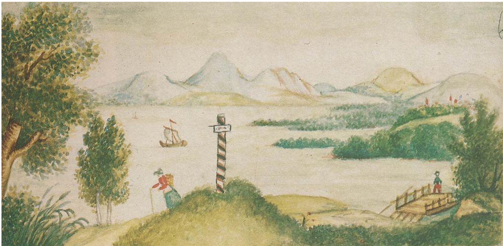
Кавказский пейзаж с озером, детский рисунок Лермонтова из альбома