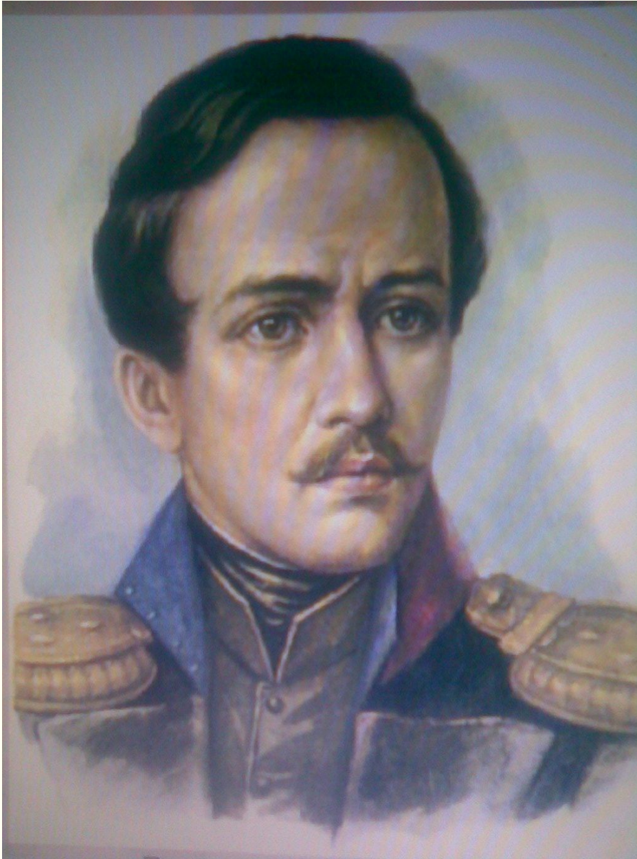
Михаил Юрьевич Лермонтов (1814-1841)