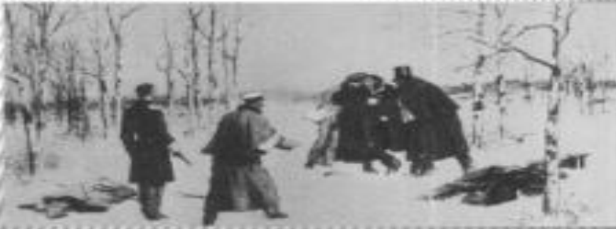
Дуэль у Черной речки

И А. С. Пушкина, и М. Ю. Лермонтова постигла участь людского непонимания и раннего ухода из жизни.