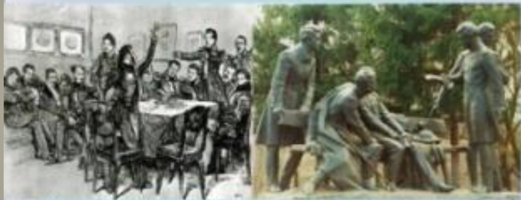
Пушкин среди декабристов в Каменице. Художник Д.Н Кардовский

Но пропадет ваш скорбный труд И дум высокое стремленье