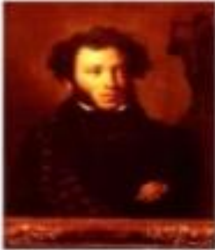
А.С.Пушкин 1799 - 1837