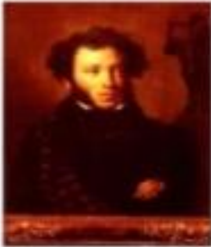
А.С.Пушкин 1799 - 1837