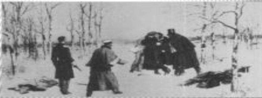
Дуэль у Черной речки

И А. С. Пушкина, и М. Ю. Лермонтова постигла участь людского непонимания и раннего ухода из жизни.