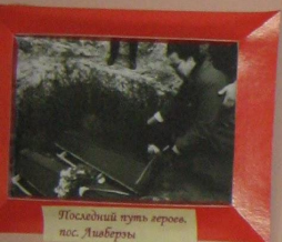
Последний путь героев, пос. Лыбержи