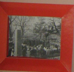
Порядочно-траурный митинг при захоронении останков героев