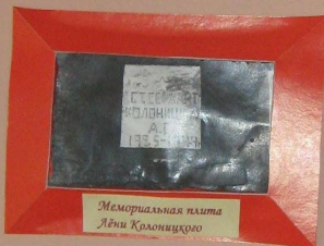
Мемориальная плита Лёни Колоницкого