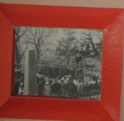
Порядочно-траурный митинг при захоронении останков героев