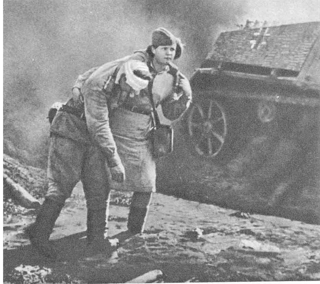
Спасая раненого война...

Я ушла из школы в грязные теплушки, В эшелон пехоты, в санитарный взвод. Дальние разрывы слушал и не слушал Ко всему привыкший сорок первый год