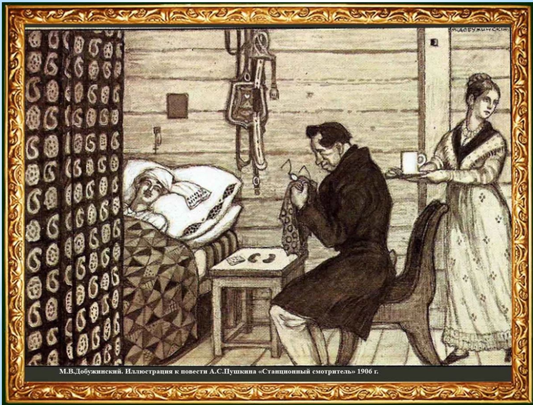
М.В.Добужинский. Иллюстрация к повести А.С.Пушкина «Станционный смотритель» 1906 г.