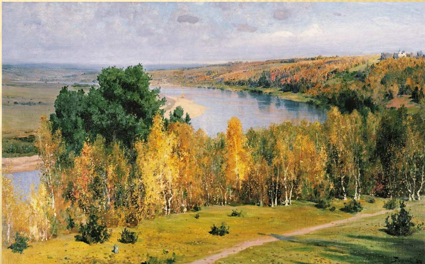
Поленов В.Д. «Золотая осень»

Унылая пора! Очей очарованье! Приятна мне твоя прощальная краса — Люблю я пышное природы увяданье, В багрец и в золото одетые леса... (А.С.Пушкин)