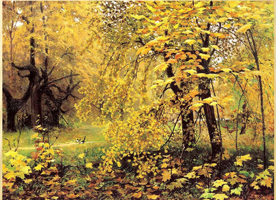
И. С. Остроухов "Золотая осень"