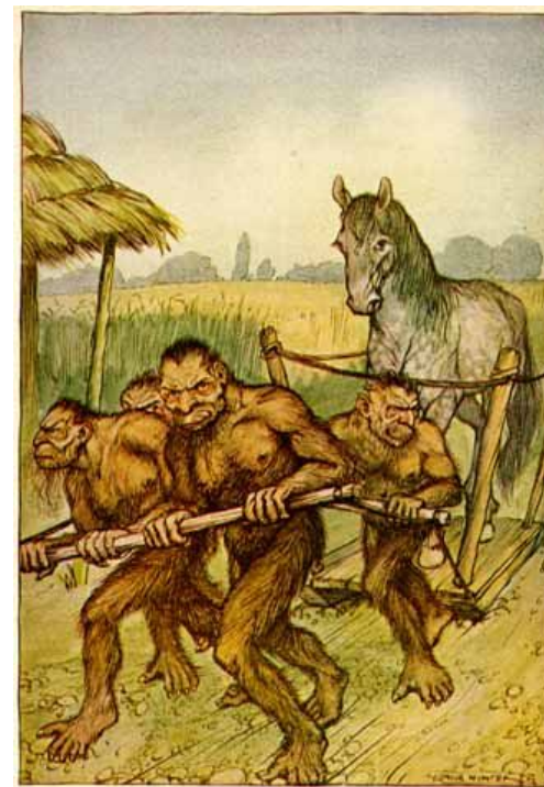
"I saw coming towards the house a kind of vehicle drawn like a sledge by four yahoos" Page 40