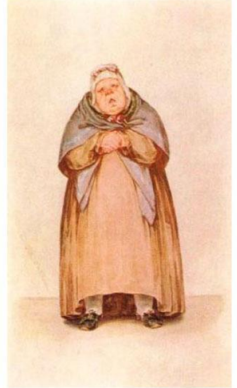
Боклевский П. М. Коробочка (Гоголь «Мёртвые души»). Источник: Орлова Т. В. Боклевский. – М.: Искусство, 1971. – Вкл. л. с. 64.

Ее поведением руководит страсть к накопительству, корысть. Гоголь на первый план выдвигает дубиноголовость, невежественность, мелочную хлопотливость Коробочки.