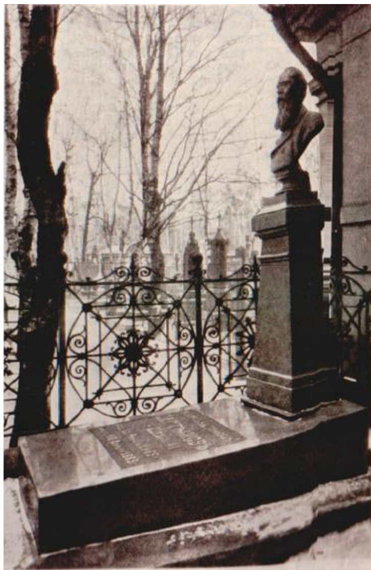
Паматникъ М. Е. Салтыкову-Шедрину на Волковомъ кладбищѣ въ С.-Петербургѣ. Фотографировано въ 1909 году.