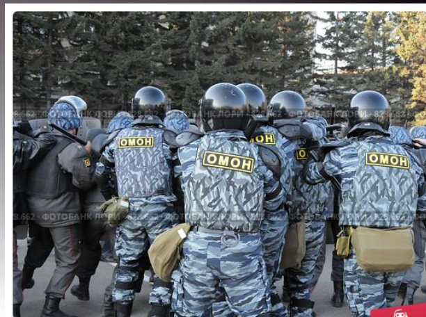
Милицейская цепь

отряд мобильный особого назначения. Основные задачи — действия в условиях крайнего осложнения оперативной обстановки, ликвидация групповых хулиганских проявлений и массовых беспорядков, задержание или ликвидация вооружённых преступников, силовая поддержка мероприятий, проводимых местными ОВД.