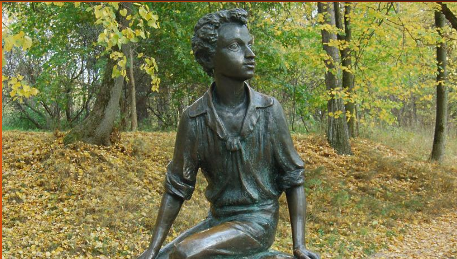
Будущий лицеист. Памятник А.С.Пушкину в Захарове . Скульптор А.Хижняк