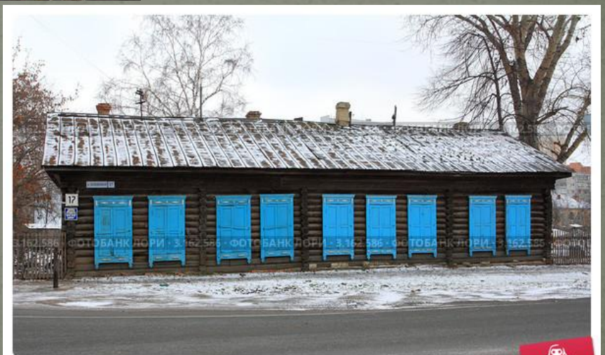
Дом с голубыми ставнями по улице Холодильная. Город Тюмень