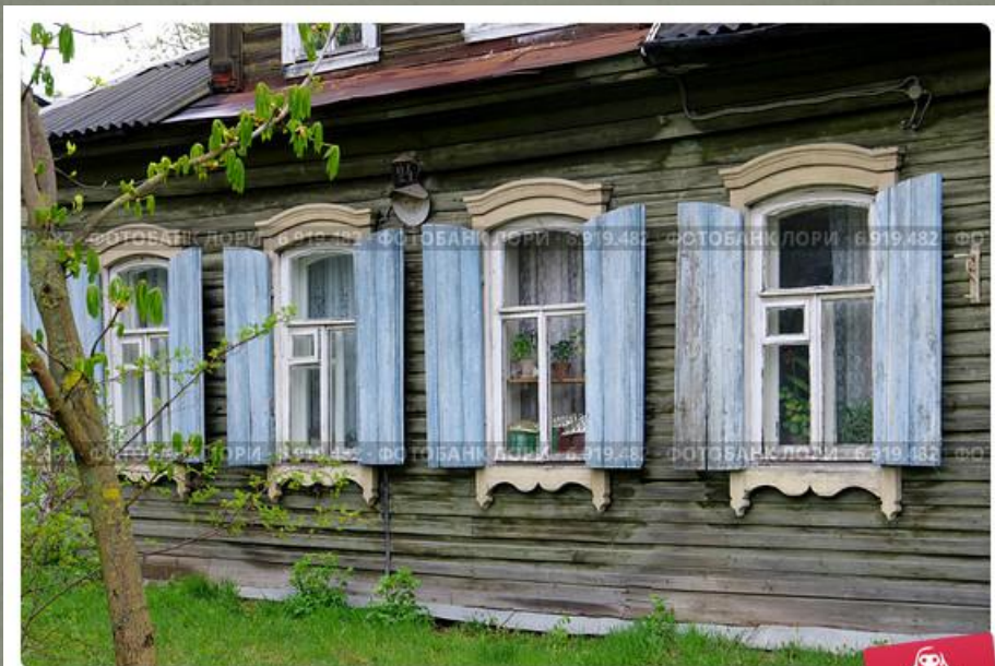
Дом с голубыми ставнями на Троицкой улице. Город Тверь