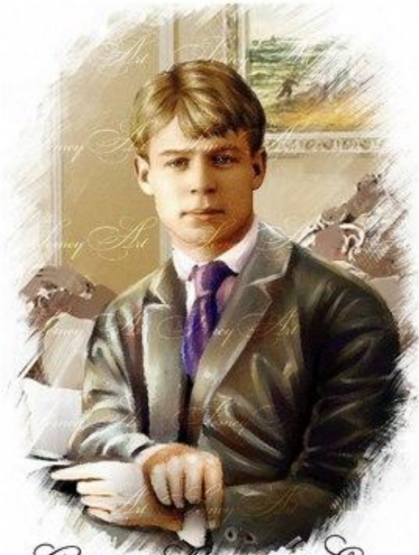
Сергей Сергеевич Есенин 1895-1925г