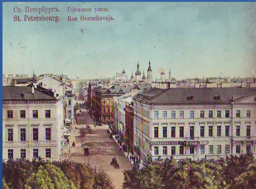
Ст. Петербургъ. Гороховая улица. St. Petersburg. Rue Gorochovaia.

Их совместные выступления со стихами и частушками, стилизованными под «крестьянскую», народную манеру (Есенин являлся публике златокудрым молодцем в расшитой рубашке и сафьяновых сапожках), имели большой успех.