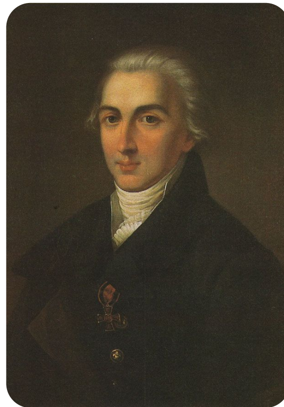
МАЛИНОВСКИЙ ВАСИЛИЙ ФЕДОРОВИЧ