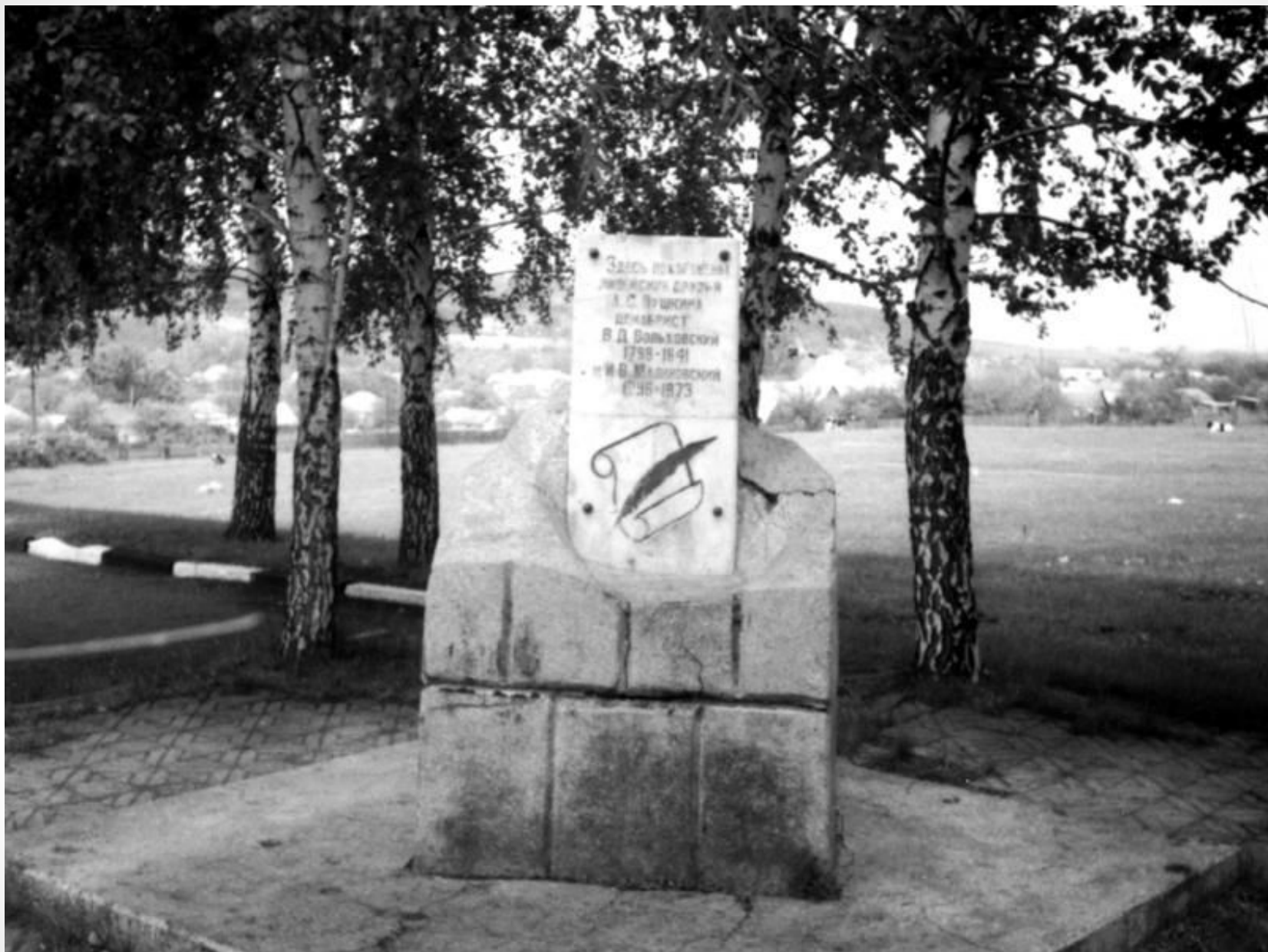
Могила И. Малиновского и В. Вольховского в Каменке