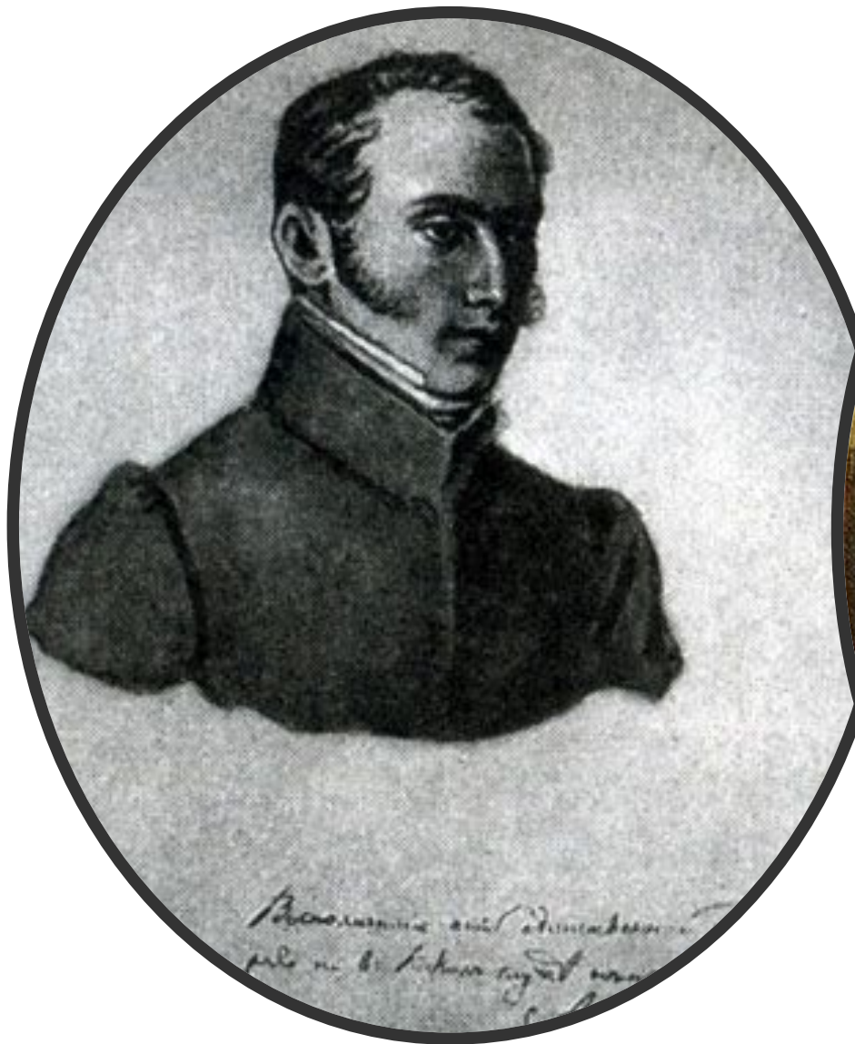
Барон Андрей Евгеньевич (фон) Розен (3 [14] ноября 1799