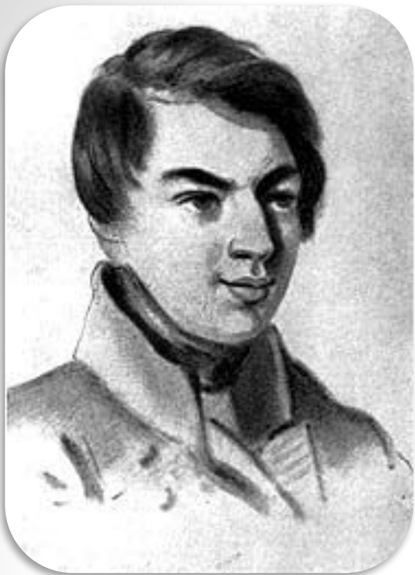
И. В. Малиновский (1796–1873),