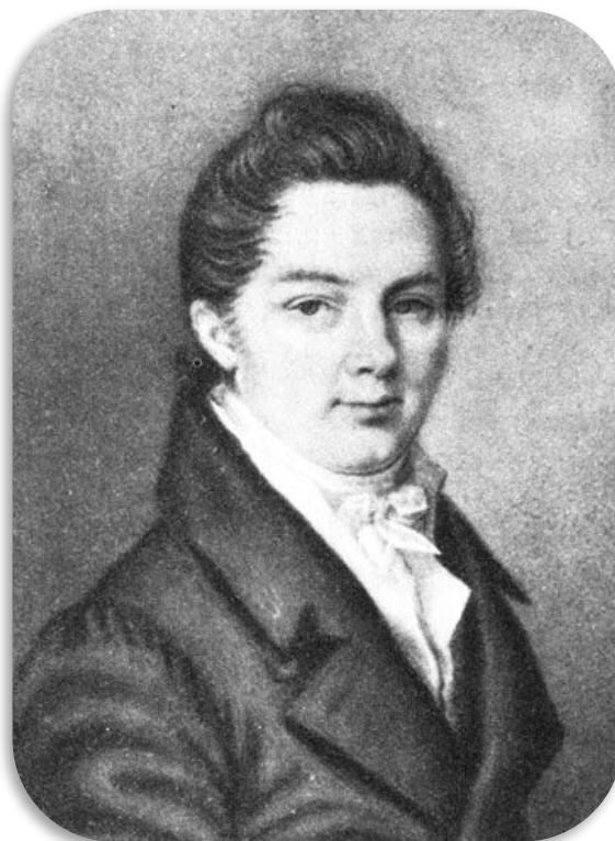
И. И. Пуцин (1798–1858)