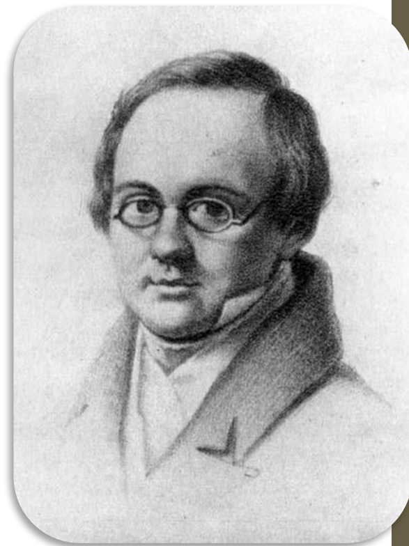
барон А. А. Дельви́г (1798–1831)