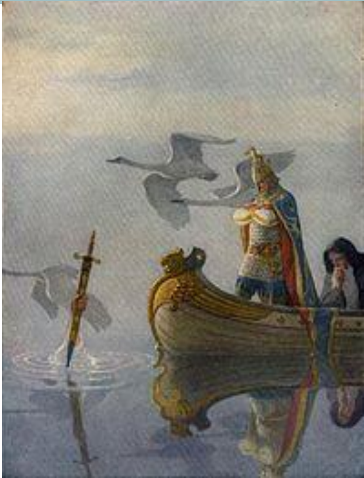
Артур получает меч Экスカлибур от Леди Озера (рис. Н. К. Уайета , 1922)