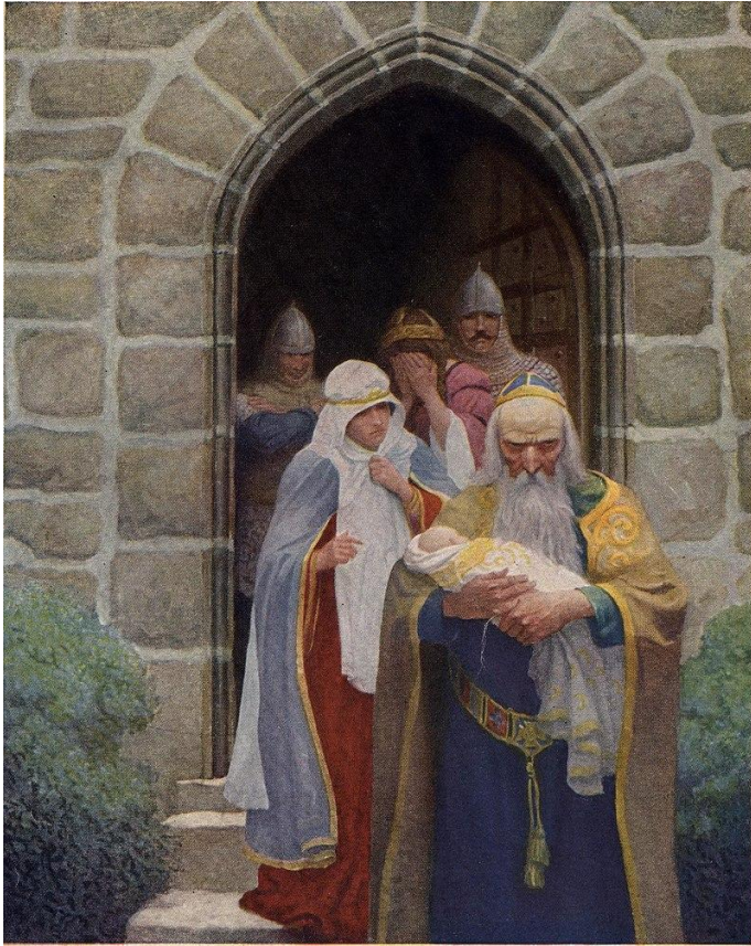
Мерлин уносит новорождённого Артура (рис. Н. К. Уайета , 1922)