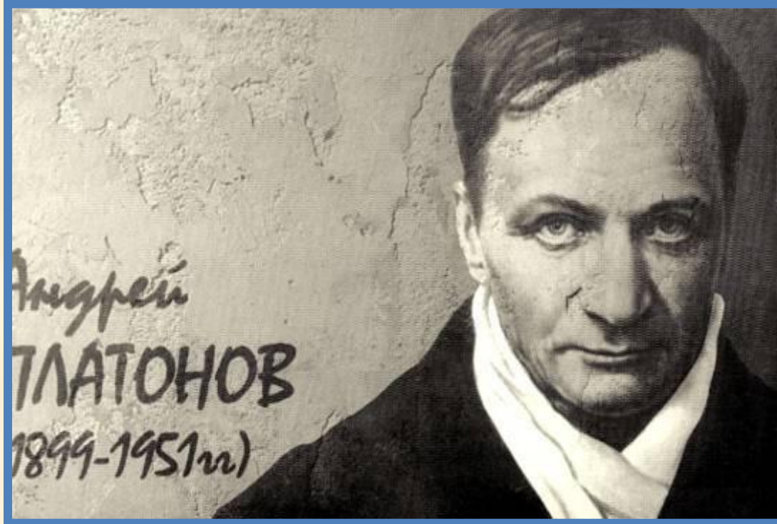
Андрей ПЛАТОНОВ 1899-1951гг)