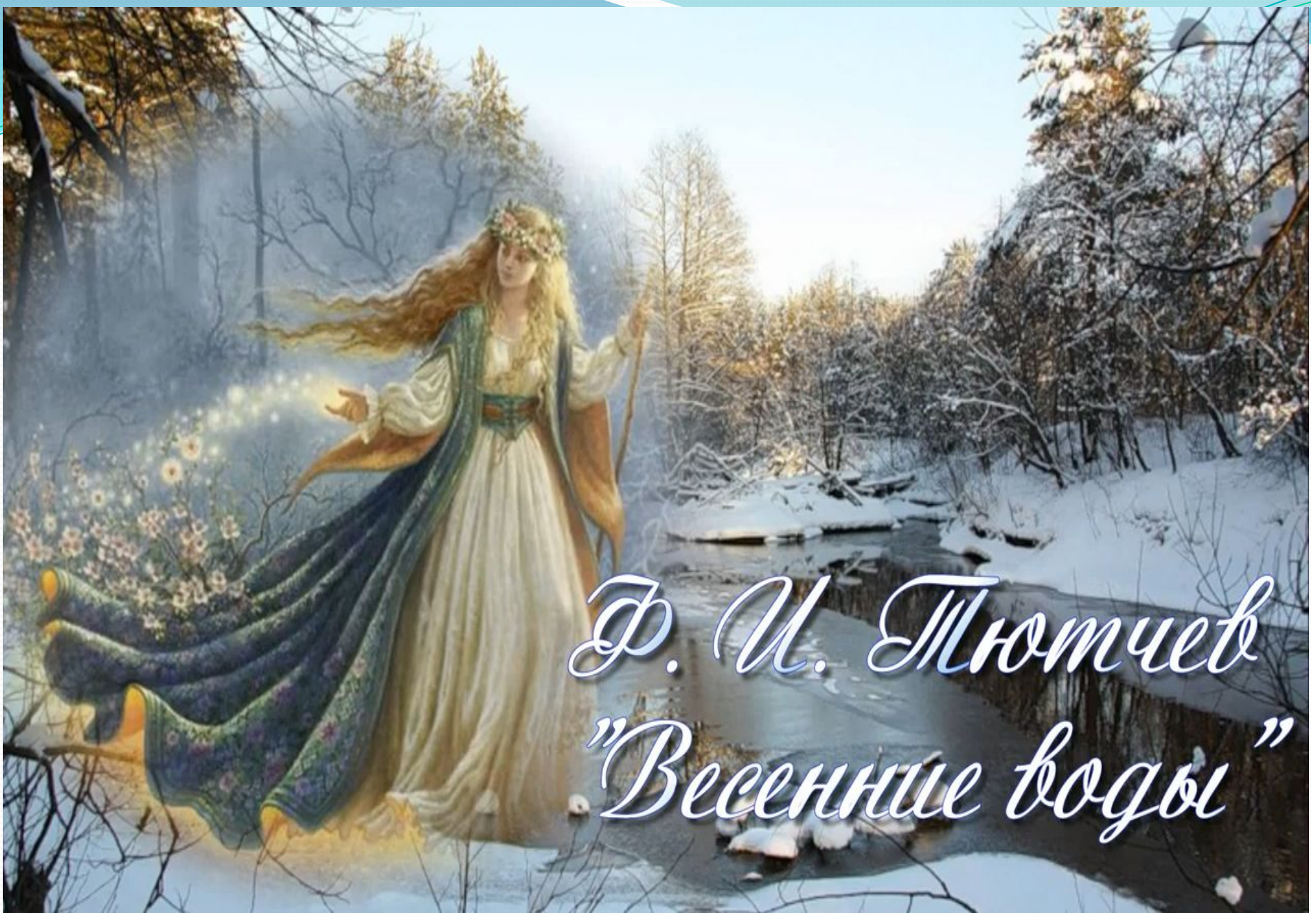
Ф. У. Тютчев "Весенние воды"