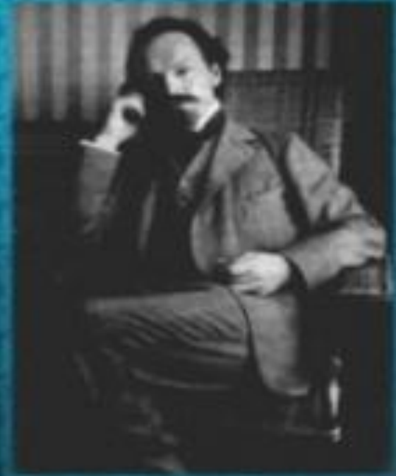
Х. Д. Бальмонт (1867 – 1942)