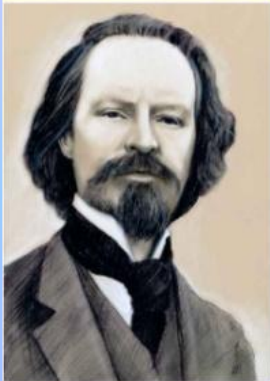
Бальмонт Константин Дмитриевич