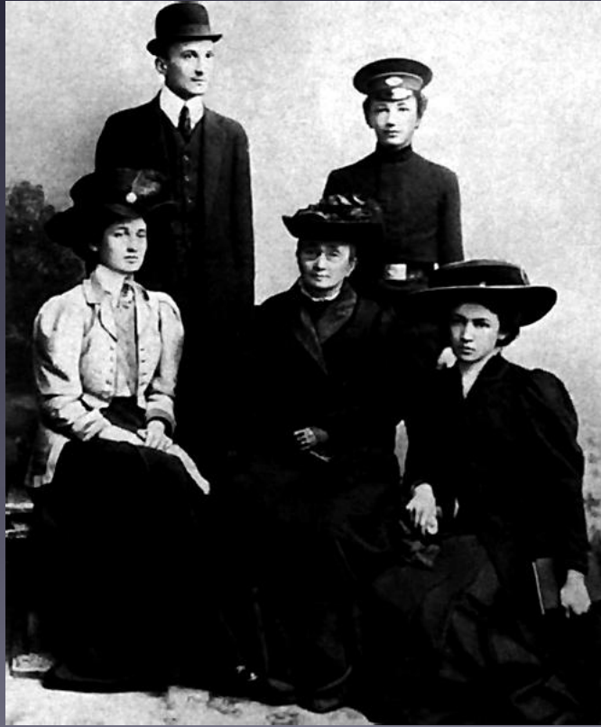
Семья Горенко: Инна Эразмовна и дети Виктор, Андрей, Анна и Ия

А.А.Горенко (Ахматова – литературный псевдоним, взятый в честь прабабушки, татарской княжны Ахматовой) родилась 11 июня 1889 года под Одессой в семье отставного инженера-механика флота. С материнской линии принадлежала к старой дворянской семье. Годовалым ребенком она была перевезена в Царское Село. Там прожила до 16 лет, каждое лето выезжала под Севастополь на море. В 1905 г. семья родителей распалась, и мать с детьми переехала в Евпаторию, оттуда в Киев. В 1907 г. Ахматова поступила на юридический факультет Высших женских курсов в Киеве.