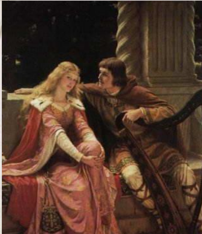
Джон Уильям Уотерхаус