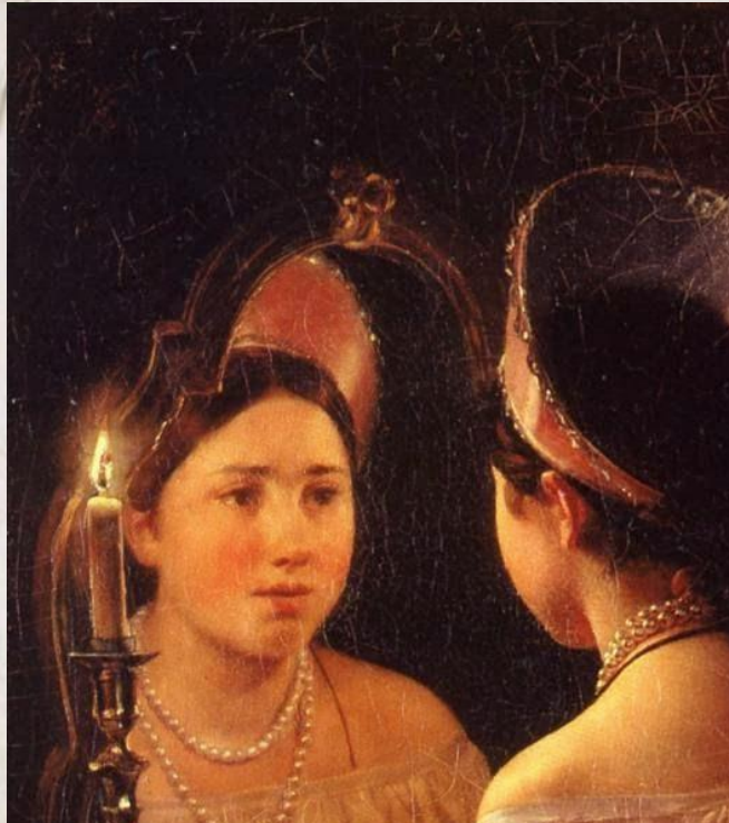
Карл Брюллов, Светлана за гаданием.