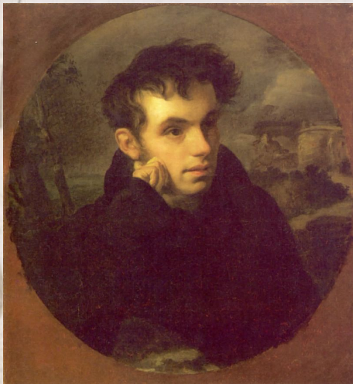
Художник Кипренский О.А.