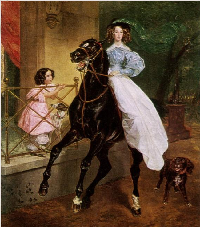
Брюллов К.П. Всадница. 1832 г.