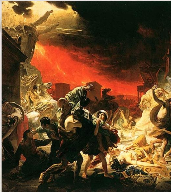
Брюллов К.П. Последний день Помпеи