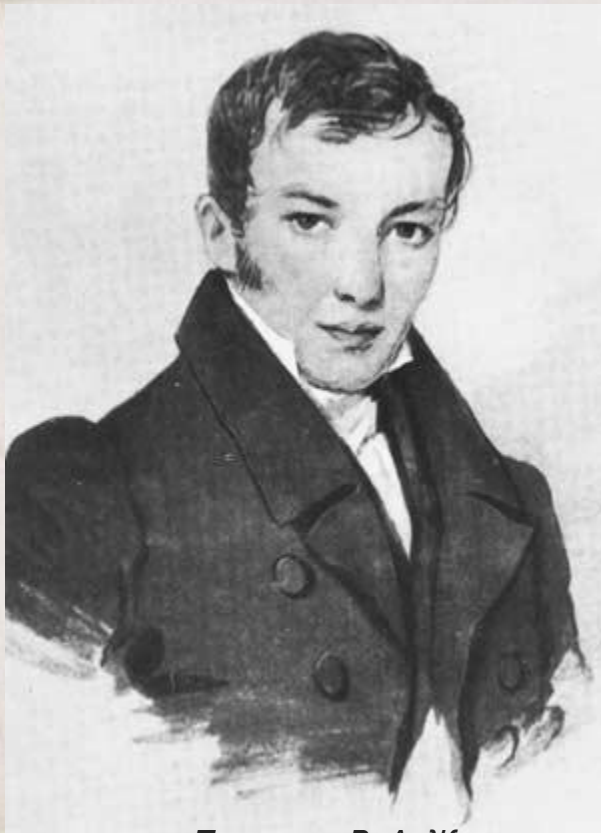
Портрет В. А. Жуковского П. Ф. Соколов, 1820-е гг.