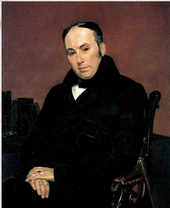
Карл Брюллов, Портрет В.А. Жуковского