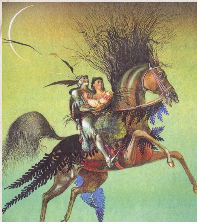
Лесной Царь. Обложка сборника баллад Жуковского