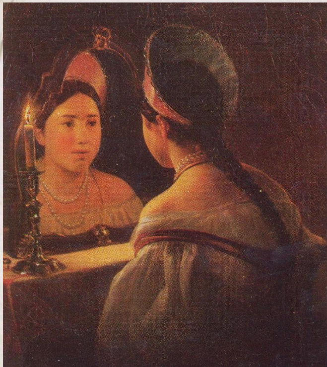
Карл Брюллов, Светлана за гаданием.