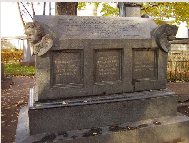
Надгробный памятник на могиле В. А. Жуковского