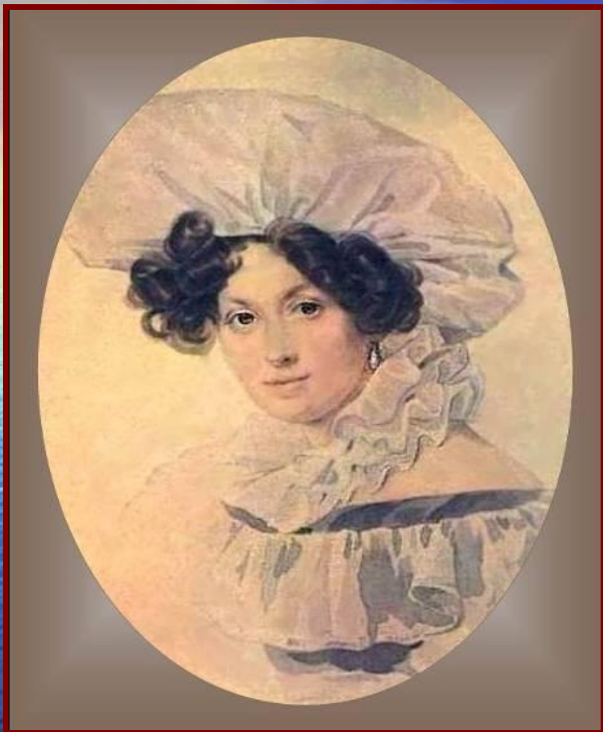
Портрет Е.П. Бакуниной П.Ф. Соколов

Первая любовь великого поэта, Екатерина Павловна Бакунина (1795-1869), была сестрой лицейского однокашника и ровесника Пушкина, Александра Бакунина. Чувство к Бакуниной вдохновляло юного поэта. Установлено, что она присутствует в 22 стихотворениях и элегиях А.С.Пушкина.