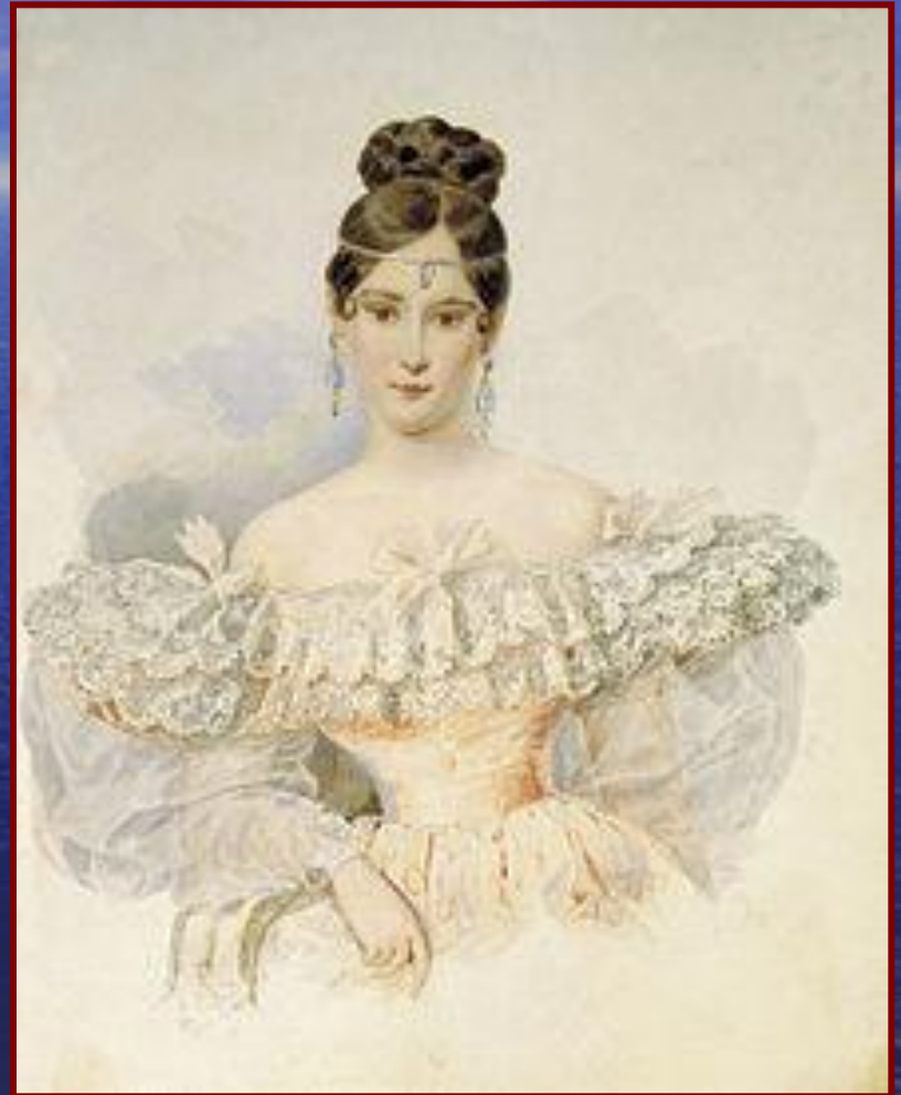
Н.Н. Гончарова, 1831 художник А.П. Брюллов