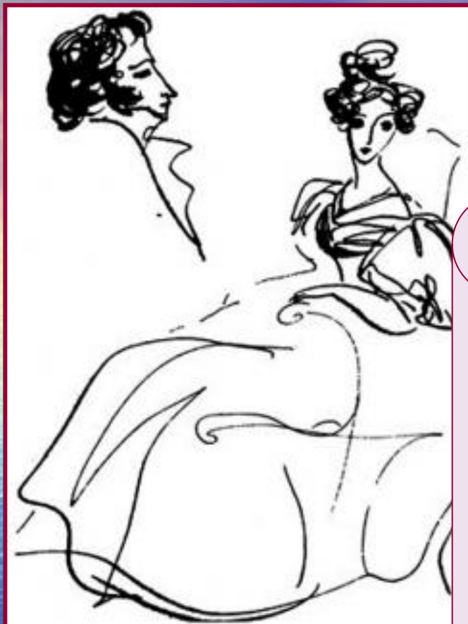
Рисунок Нади Рушевой