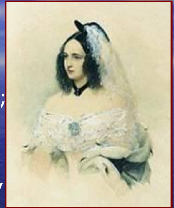
Н.Н. Пушкина, 1843 Художник В.И. Гау

На холмах Грузии лежит ночная мгла; Шумит Арагва предо мною. Мне грустно и легко; печаль моя светла; Печаль моя полна тобою, Тобой, одной тобой... Унынья моего Ничто не мучит, не тревожит, И сердце вновь горит и любит — оттого, Что не любить оно не может.