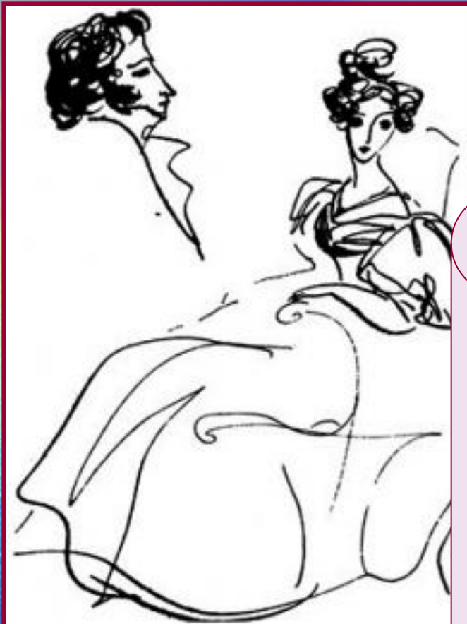
Рисунок Нади Рушевой