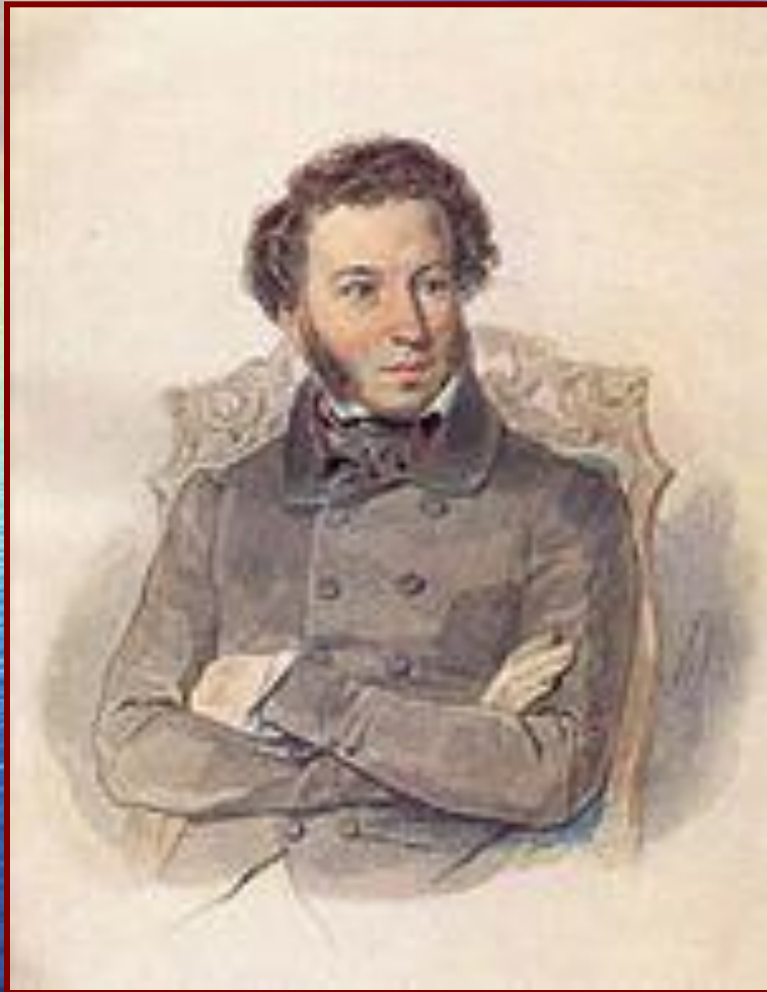
А.С. Пушкин, художник П.Ф. Соколов