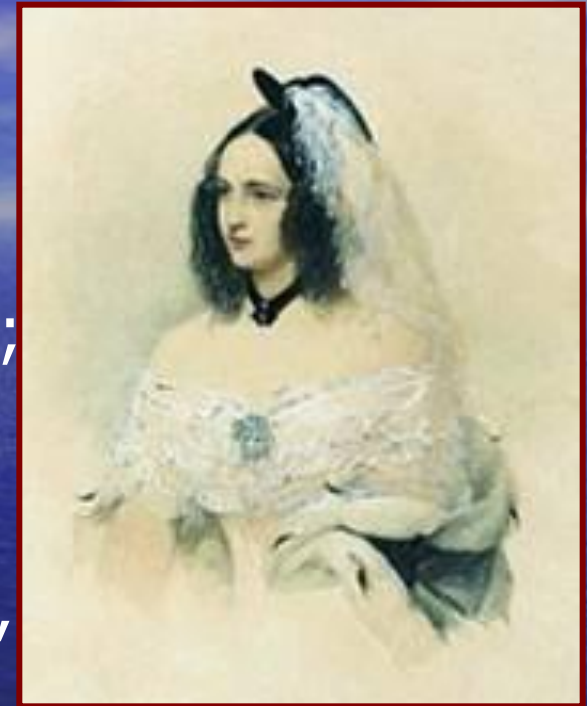
Н.Н. Пушкина, 1843 Художник В.И. Гау

На холмах Грузии лежит ночная мгла; Шумит Арагва предо мною. Мне грустно и легко; печаль моя светла; Печаль моя полна тобою, Тобой, одной тобой... Унынья моего Ничто не мучит, не тревожит, И сердце вновь горит и любит — оттого, Что не любить оно не может.