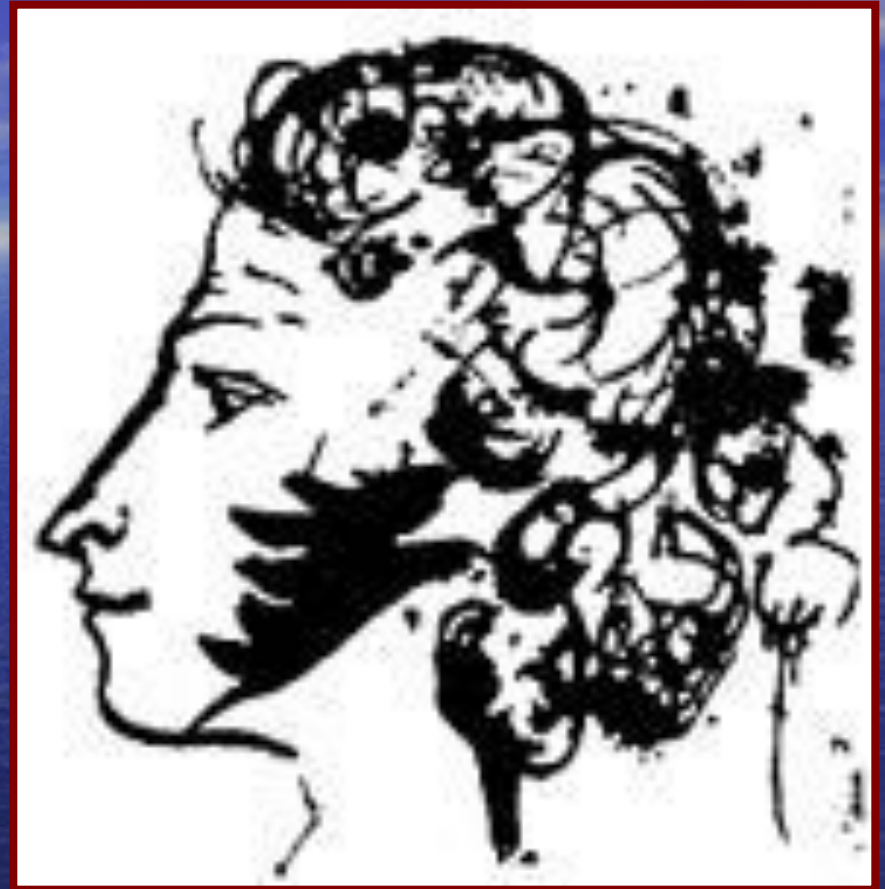
А.С. Пушкин «Автопортрет»

Из стихотворения «Мой портрет», 1814, написанного по-французски в Лицее