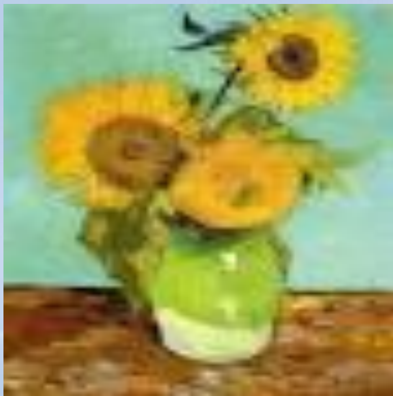
Винсент Ван Гог «Подсолнухи»