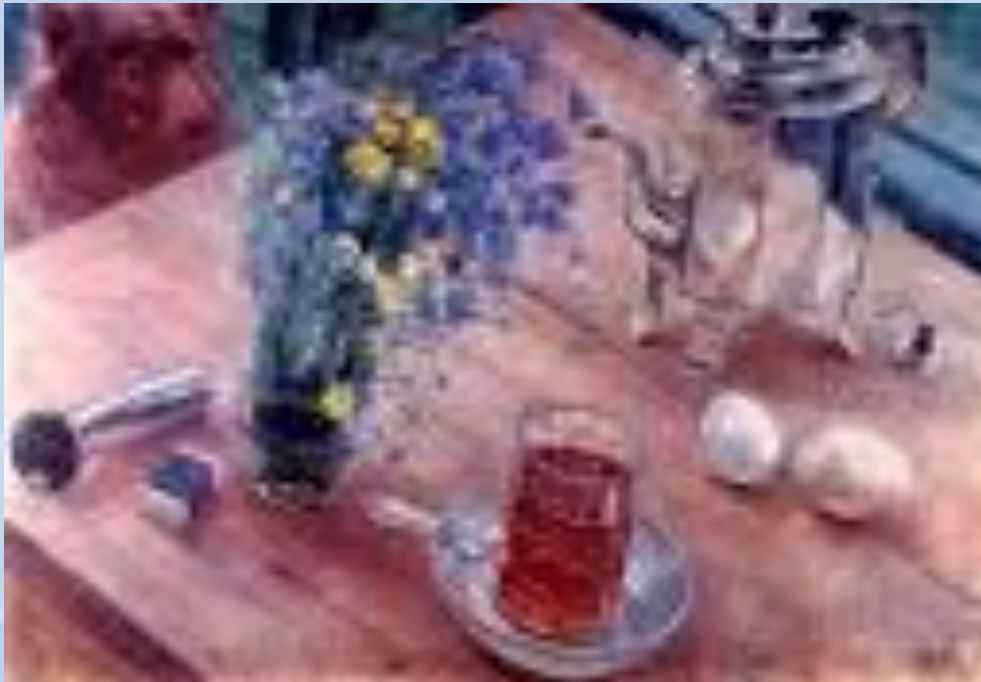
Кузьма Петров-Водкин «Утренний натюрморт»,