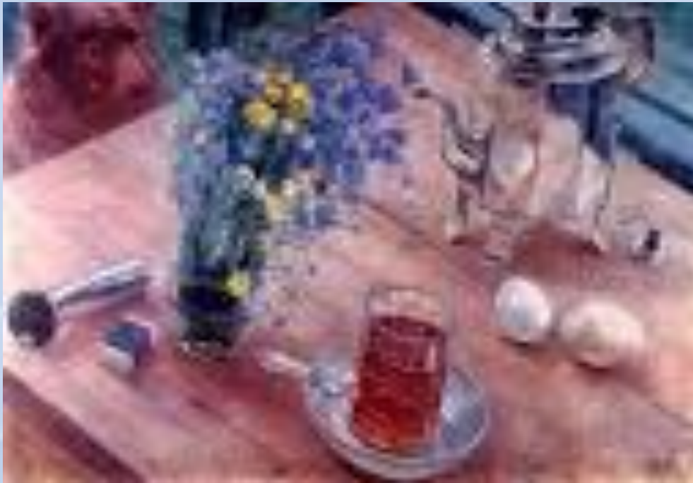
Кузьма Петров-Водкин «Утренний натюрморт»,