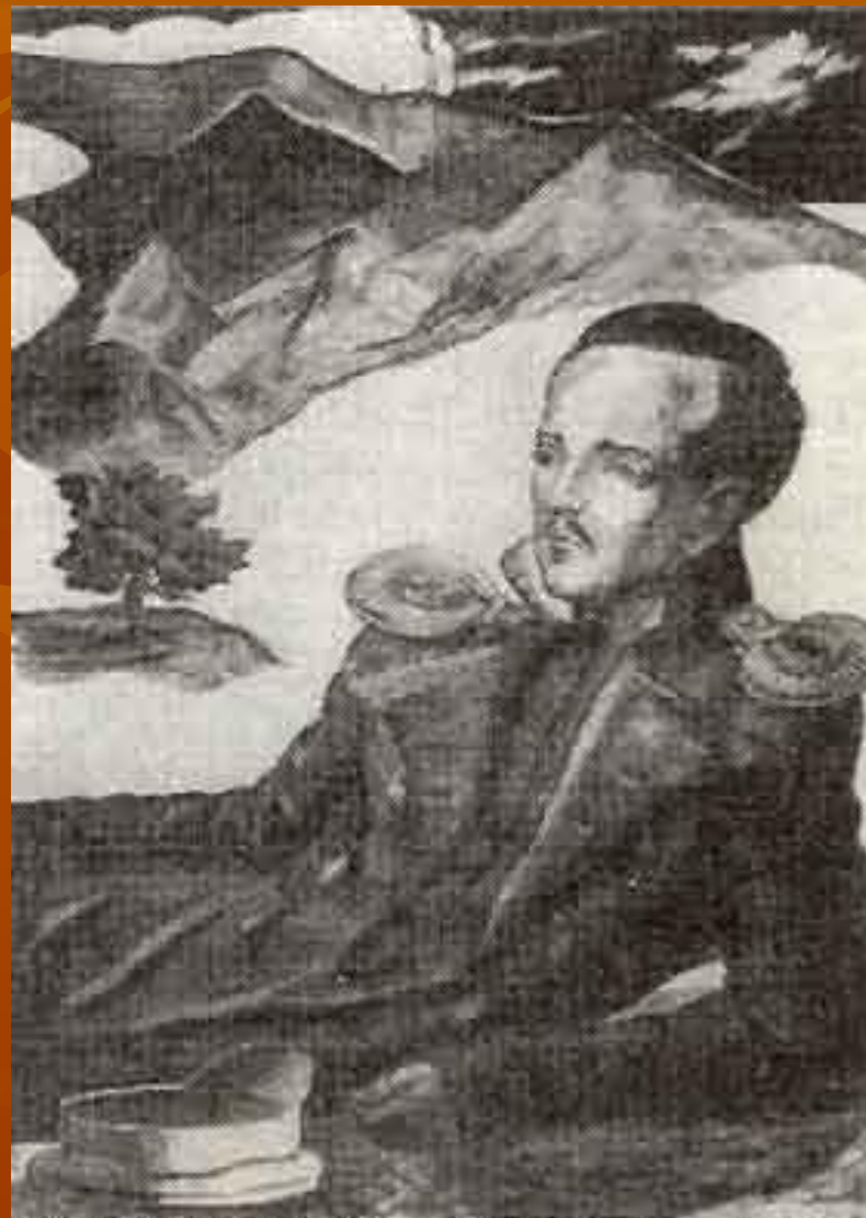
В.А. Фаворский, 1831 г.