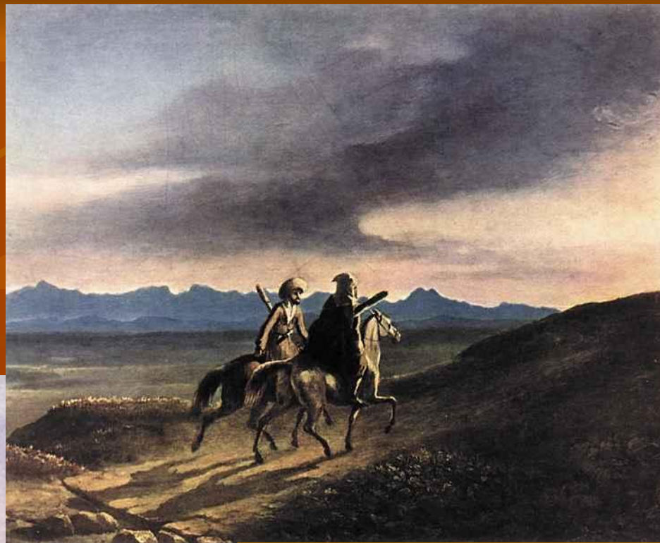
Рисунки М.Ю Лермонтова