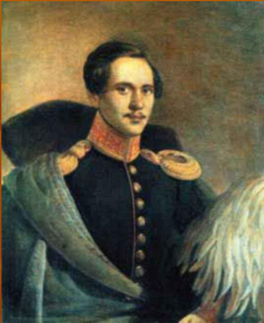
Пётр Захаров-Чеченец. 1834 г. Лермонтов – юнкер.