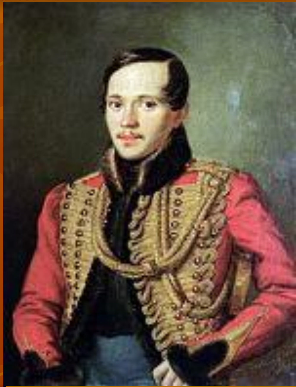
П.Е. Заболотский, 1837 г.