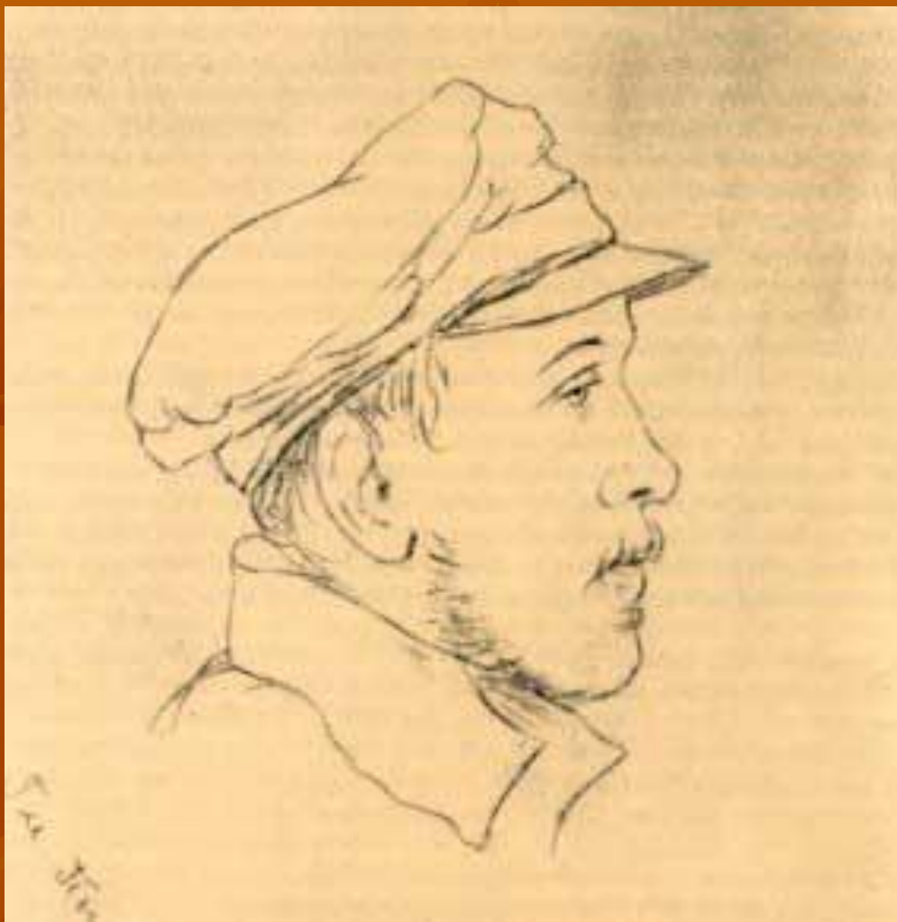
Д.П Пален. 1840 г.