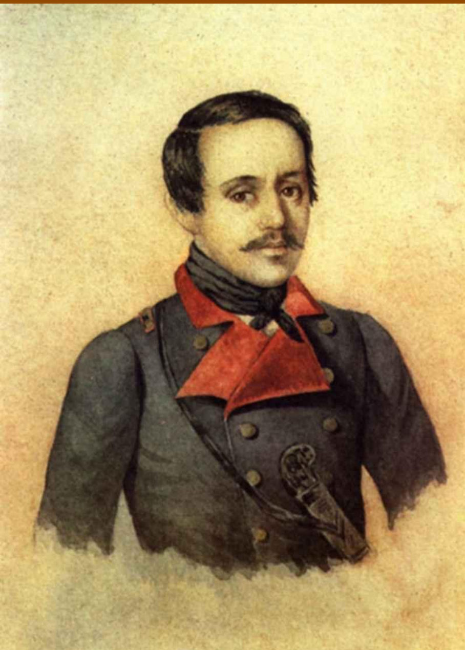
К.А. Горбунов. 1841 г. В сюртуке Тенгинского пехотного полка