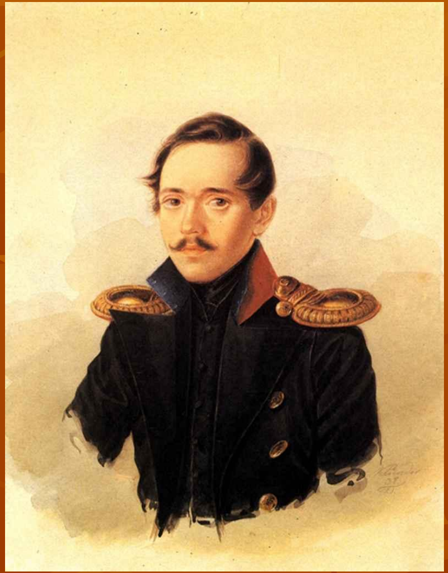
А.И. Клюндер. Гравюра на стали.