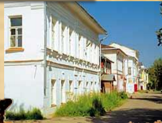
Улица со старыми домами, по которой могли гулять герои «Ревизора»