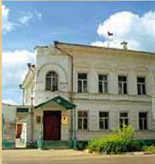
Дом администрации города, в котором мог управлять делами Городничий

Городничий: «Да отсюда, хоть три года скачи, ни до какого государства не доедешь»