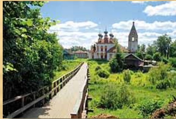
Почти центр города...

Ю.Манн, литературовед: «Сила «Ревизора» в том, что это особый город. Все нормы общежития, обращения людей друг к другу выглядят как повсеместные..Перед нами весь мир русской жизни, «вся Русь»