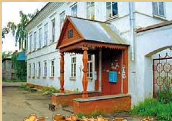
Старинный особняк, где мог жить Сквозник-Дмухановский