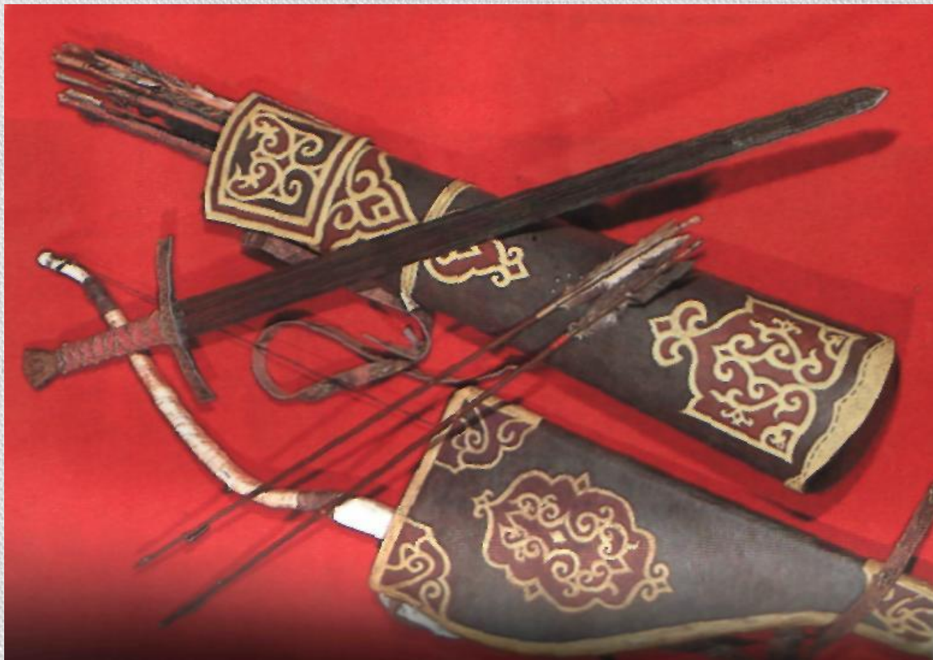
Лук в налучье, колчан со стрелами, меч в ножнах. XIVв.