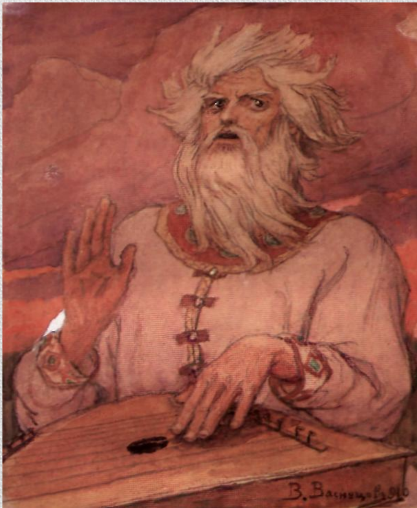
В.М.Васнецов. Баян. 1910г.

Былины – устные народные песни-сказания о подвигах богатырей.