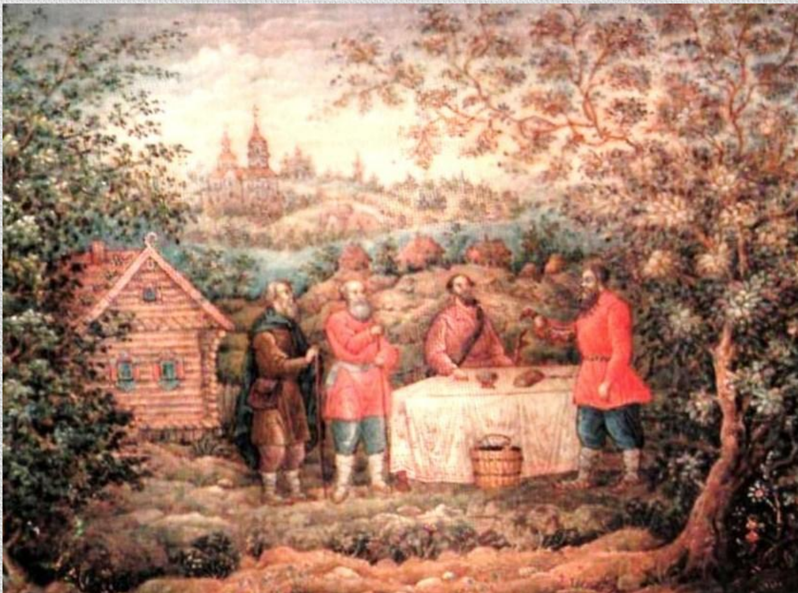
И.А.Фомичёв. Илья Муромец и калики перехожие. 1958. Мстерская лаковая миниатюра.