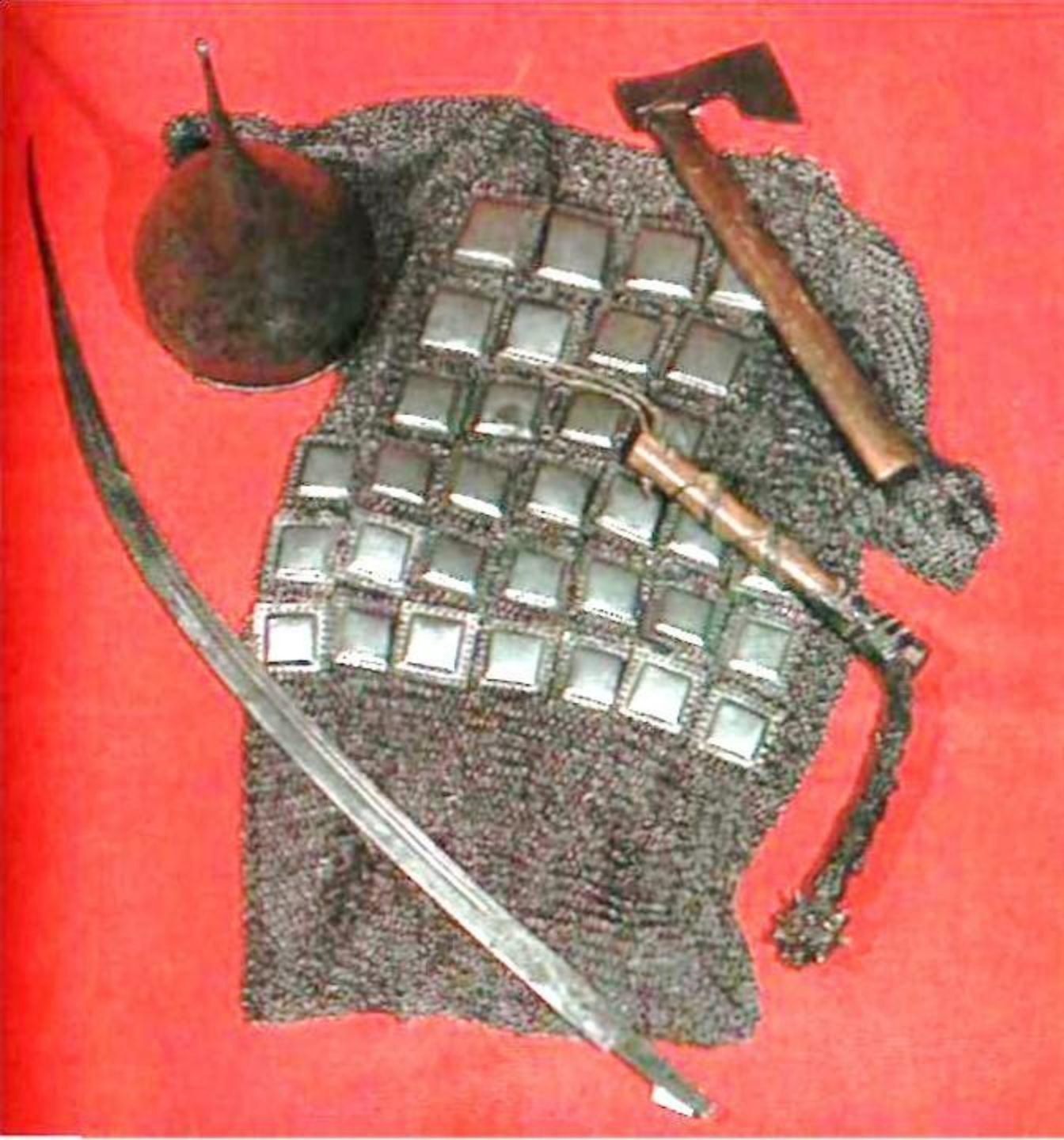
Сабля, шлем, бахтерец, топор, кистень. (XV-XVI вв.)