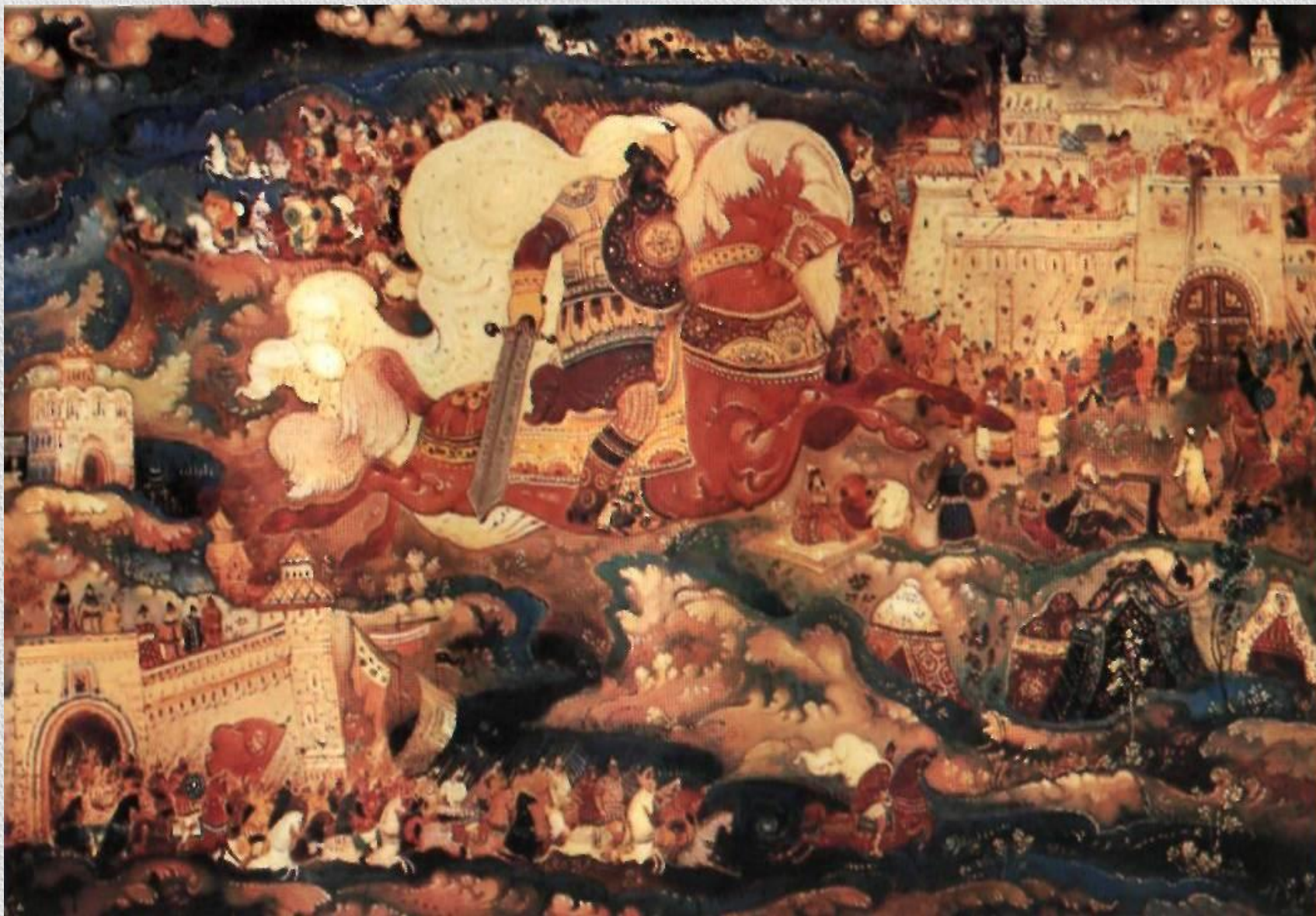
Л.А. Фомичёв. Илья Муромец. 1962. Мстерская лаковая миниатюра.