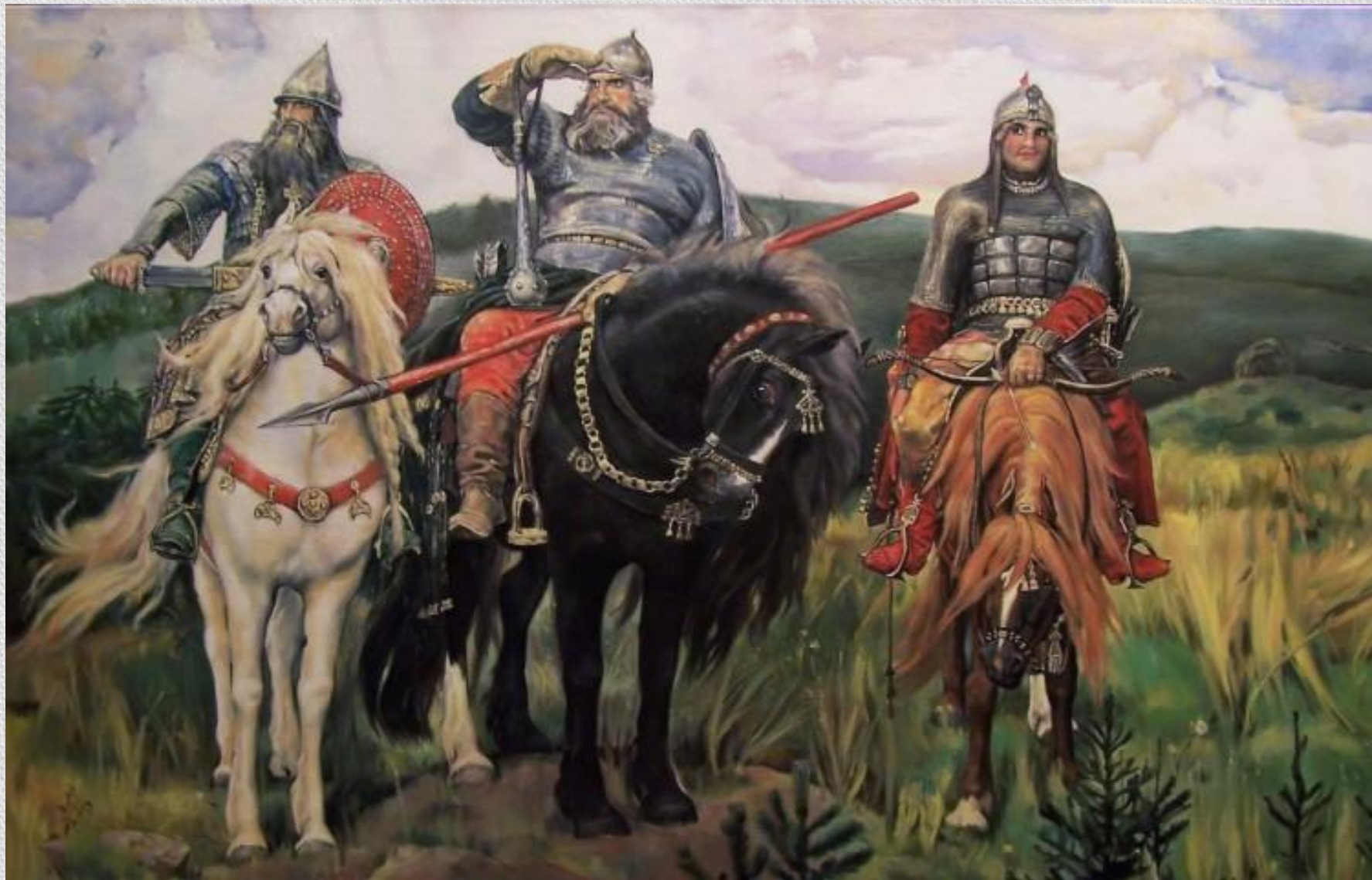
В.М.Васнецов. Богатыри. 1881-1898.