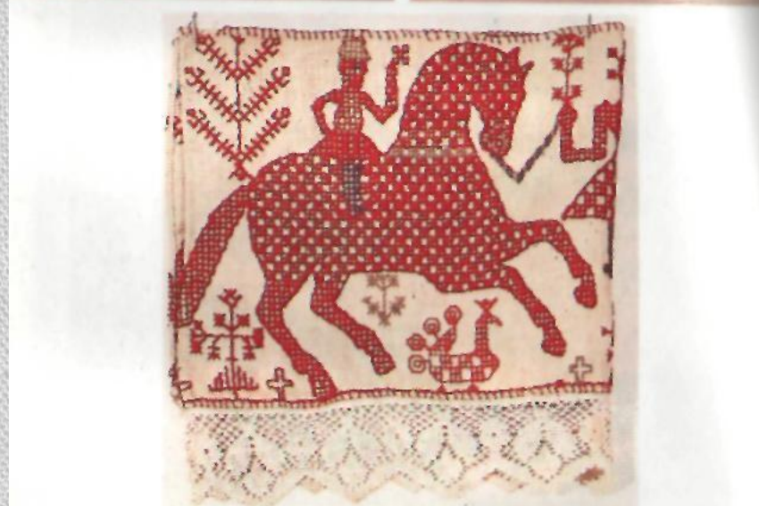
Всадник. Вышивка. Конец XIXв. Вологодская обл.