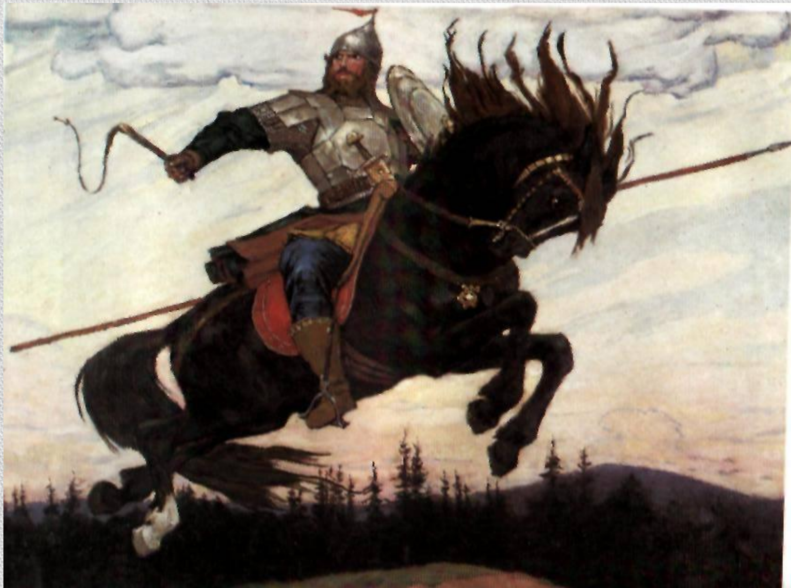
В.М.Васнецов. Богатырский скак..1914