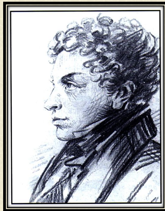
Пушкин Л.С. (брат)