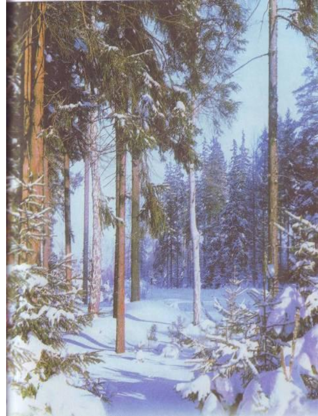
АС Пушкин «Зимнее утро».