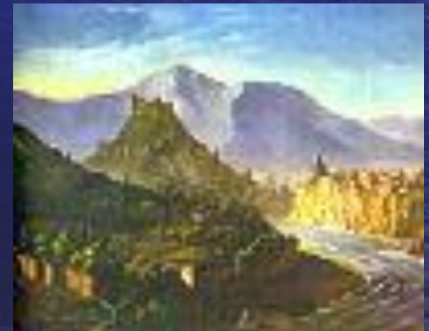
Вдохновенно воспетый Лермонтовым Кавказ