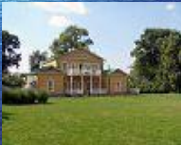
Усадьба "Тарханы" (Пенза)