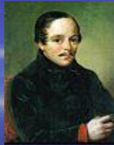
Лермонтов в штатском сюртуке. 1840. Художник П.Е. Заболотский