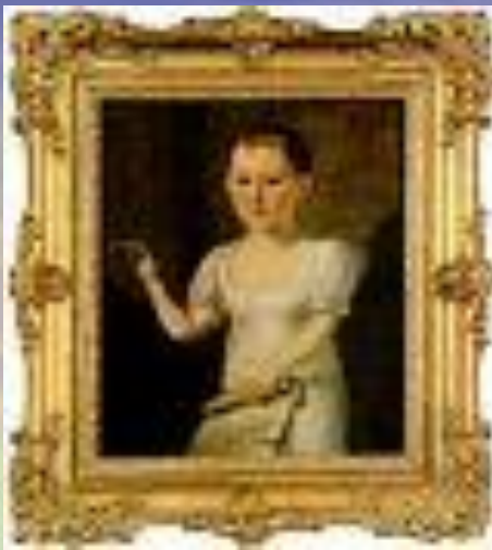
Лермонтов в детском возрасте. 1817-1818.