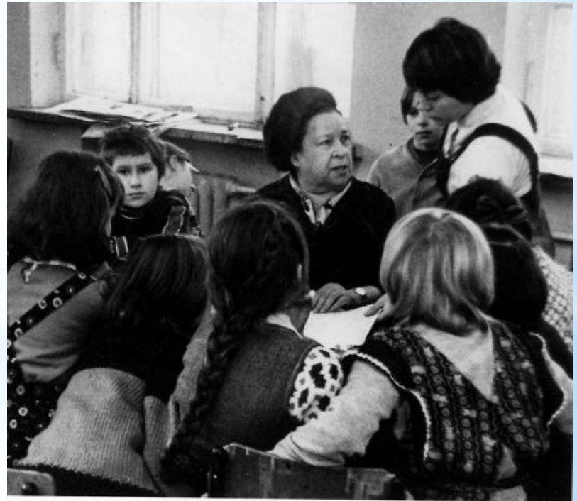
Агния Барто с учащимися школы. 1978 г.

Агния Львовна часто встречалась с ребятами и читала им свои СТИХИ.