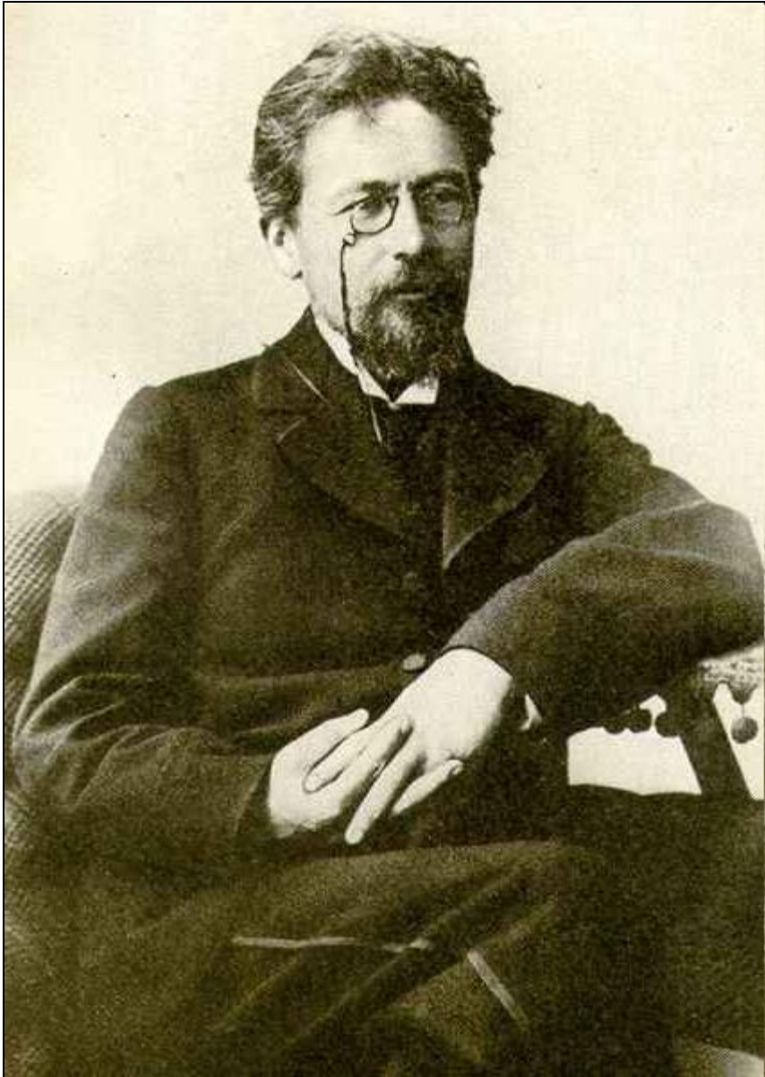
Антон Павлович Чехов. Фотография 1899г.