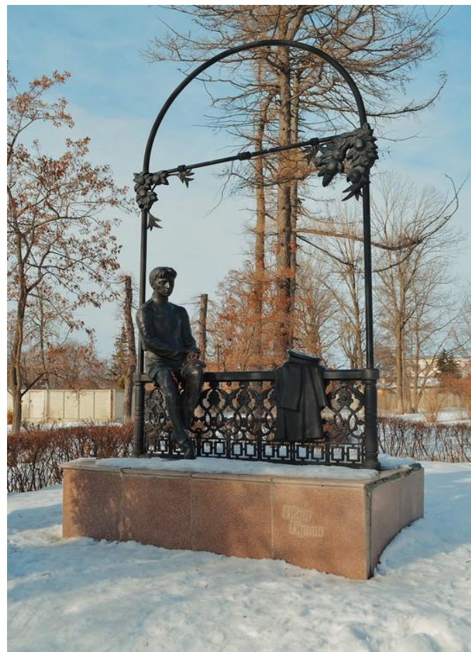
Памятник Ивану Бунину в Ельце