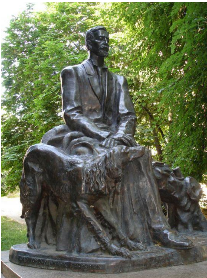
Памятник Ивану Бунину в Воронеже.