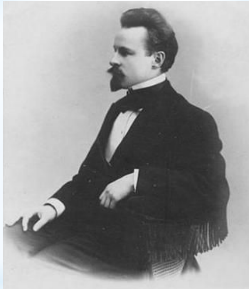
* Константин Дмитриевич Бальмонт