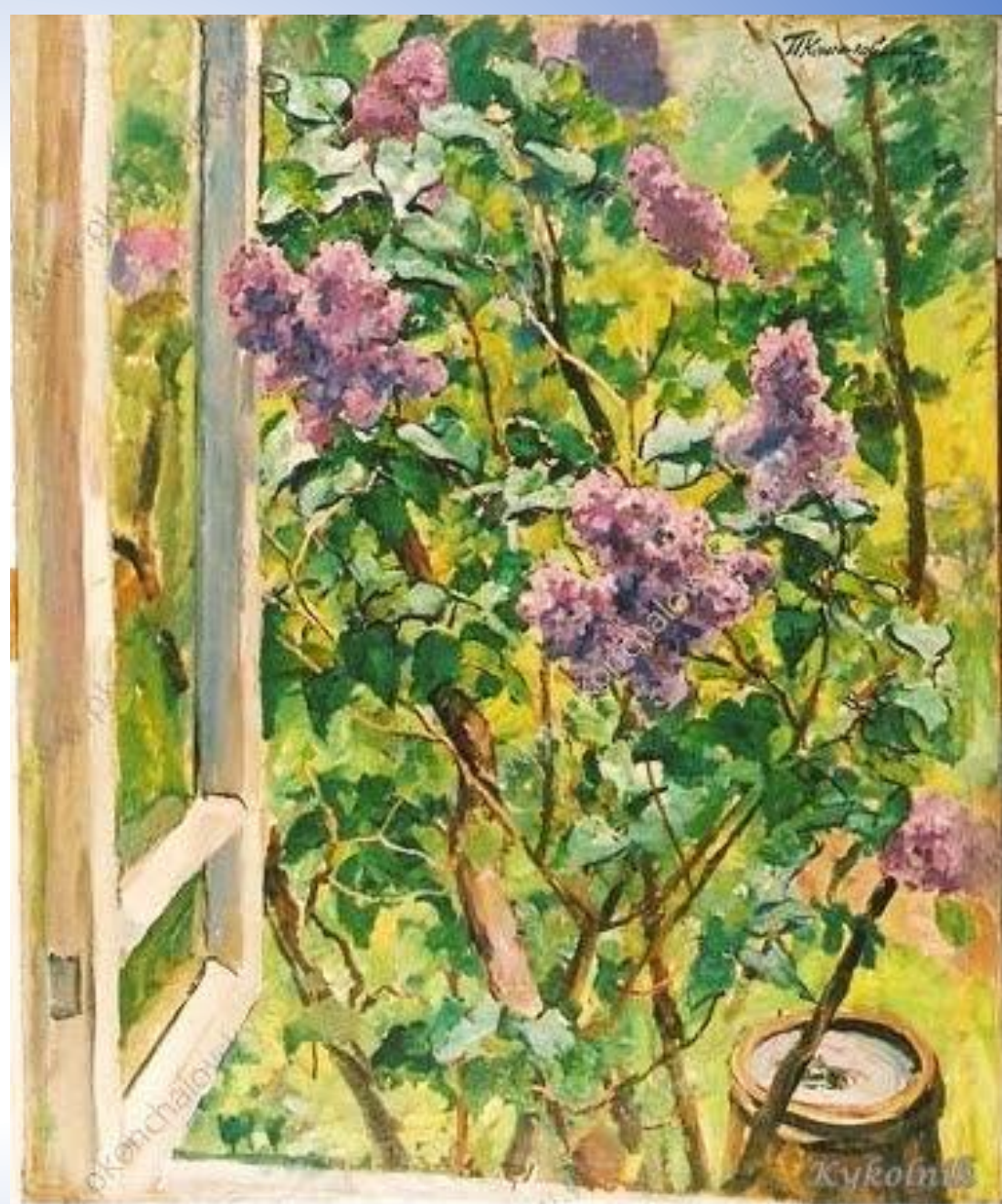
«Сирень в окне» 1940