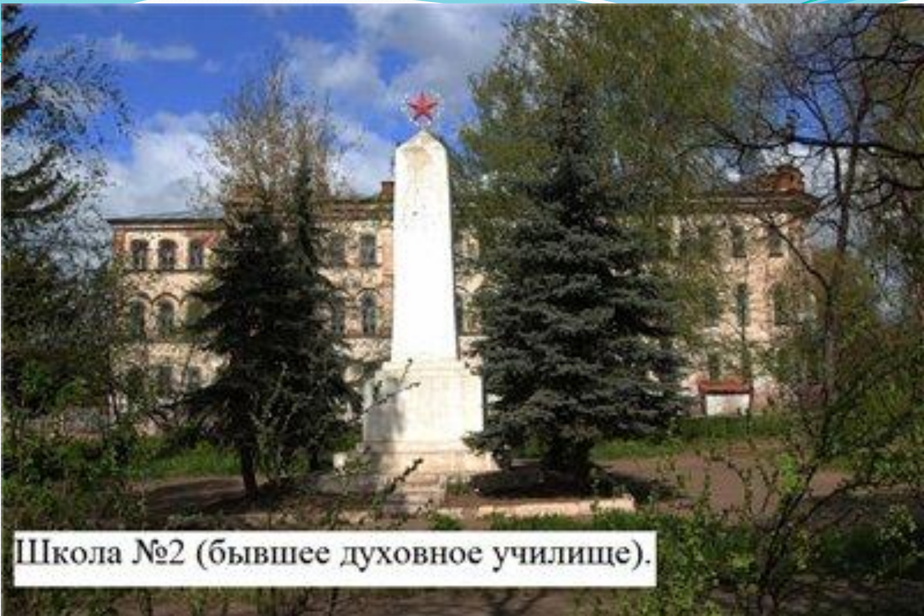
Школа №2 (бывшее духовное училище).