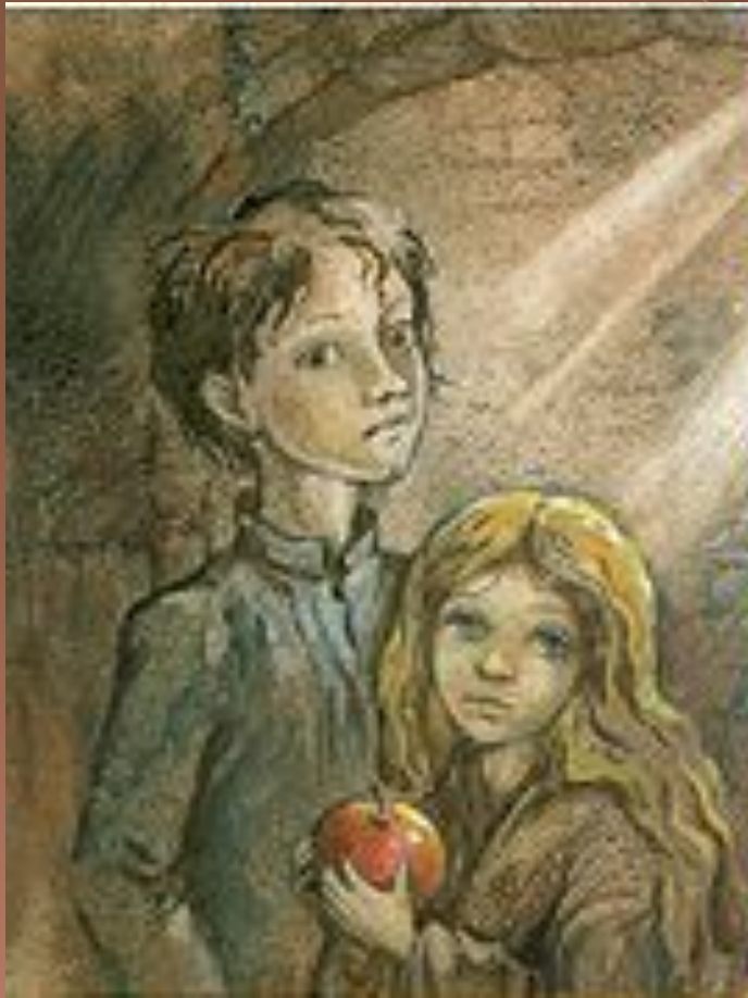
Валек и Маруся

В повести противопоставляются Маруся и Соня. Такое противопоставление называется антитезой. Маруся – худенькая маленькая девочка четырех лет.