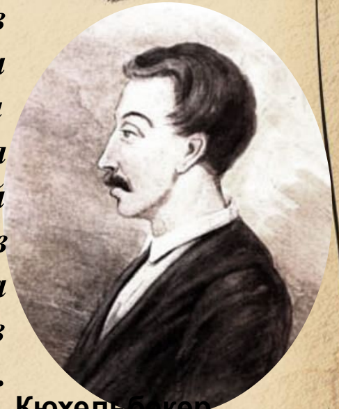
Кюхельбекер Вильгельм Карлович. Гравюра художника И. Матюшина