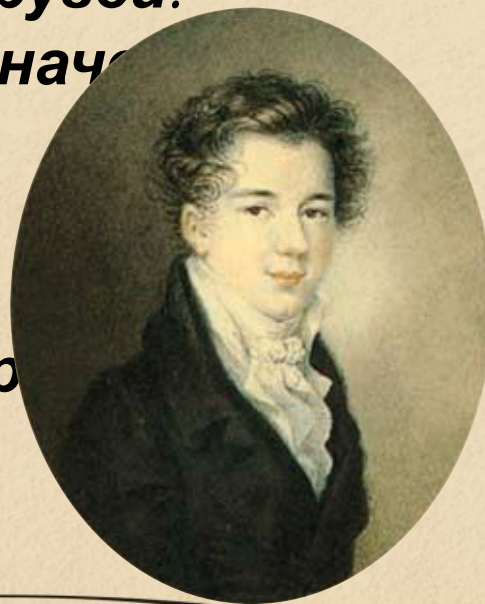
Александр Михайлович Горчаков. Художник Ф. Верне