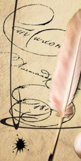
Антон Антонович Дельви́г.

Антон Дельви́г, поэт, критик, журналист. На вступительных экзаменах в Царскосельский лицей познакомился с А. С. Пушкиным; знакомство переросло в теснейшую дружбу. С 1824 издавал альманах “Северные цветы”, в 1830 редактировал “Литературную газету”. Приезжал в Михайловское навестить Пушкина.