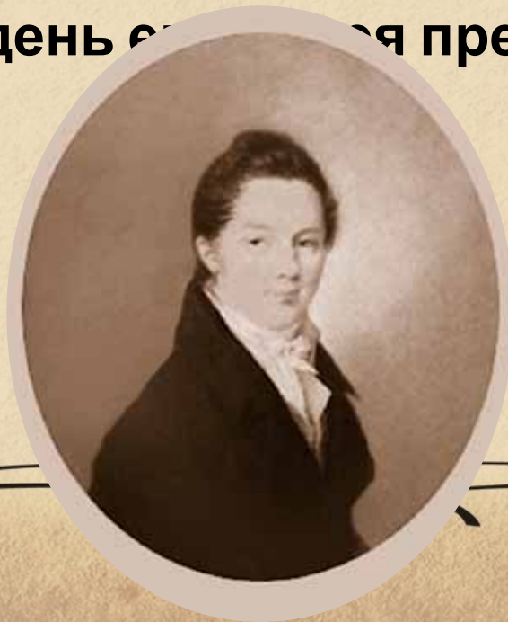
Пуцин Иван Иванович. Художник Ф.Верне

Поэта дом опальный, О Пущин мой, ты первый посетил; Ты усладил изгнанья день печальный, Ты в день е... я превратил.