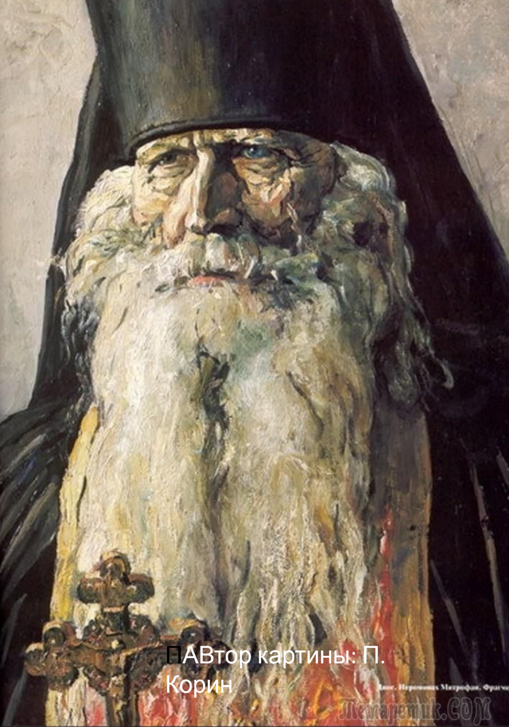
Автор картины: П. Корин