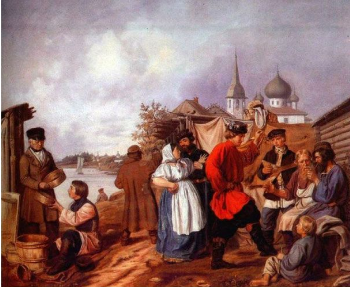
Попов А. А. Народная сцена на ярмарке в Старой Ладогe. 1853. Масло. (В центре парень в праздничной рубахе из алого шелка)

Шангина И. И. Русский традиционный быт. Энциклопедический словарь. – СПб.: Азбука-классика, 2003. – С. 594.