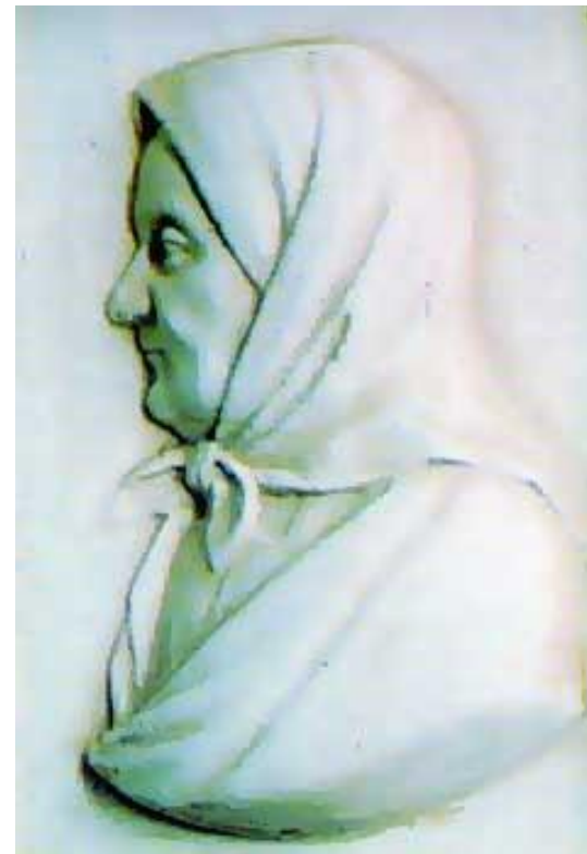
Яковлева Арина Родионовна

Любовь к родному языку маленькому Пушкину привили бабушка, Мария Алексеевна Ганнибал, превосходно говорившая и писавшая по-русски, и няня Арина Родионовна.