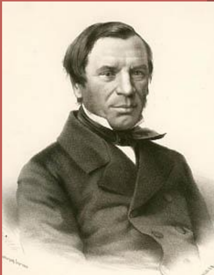
М. П. Погодин

До 14 лет Фет жил и учился дома, а затем в городе Верро (Лифляндскій губернии), в пансионе Кроммера. В 1837 г. его перевезли в Москву и поместили у М. П. Погодина; вскоре за тем Афанасий Афанасьевич поступил в Московский университет, на историко-филологический факультет. Почти все студенческое время Фет прожил в семье своего товарища по университету, будущего литературного критика Аполлона Григорьева, имевшего влияние на развитие поэтического дара Афанасия Фета.